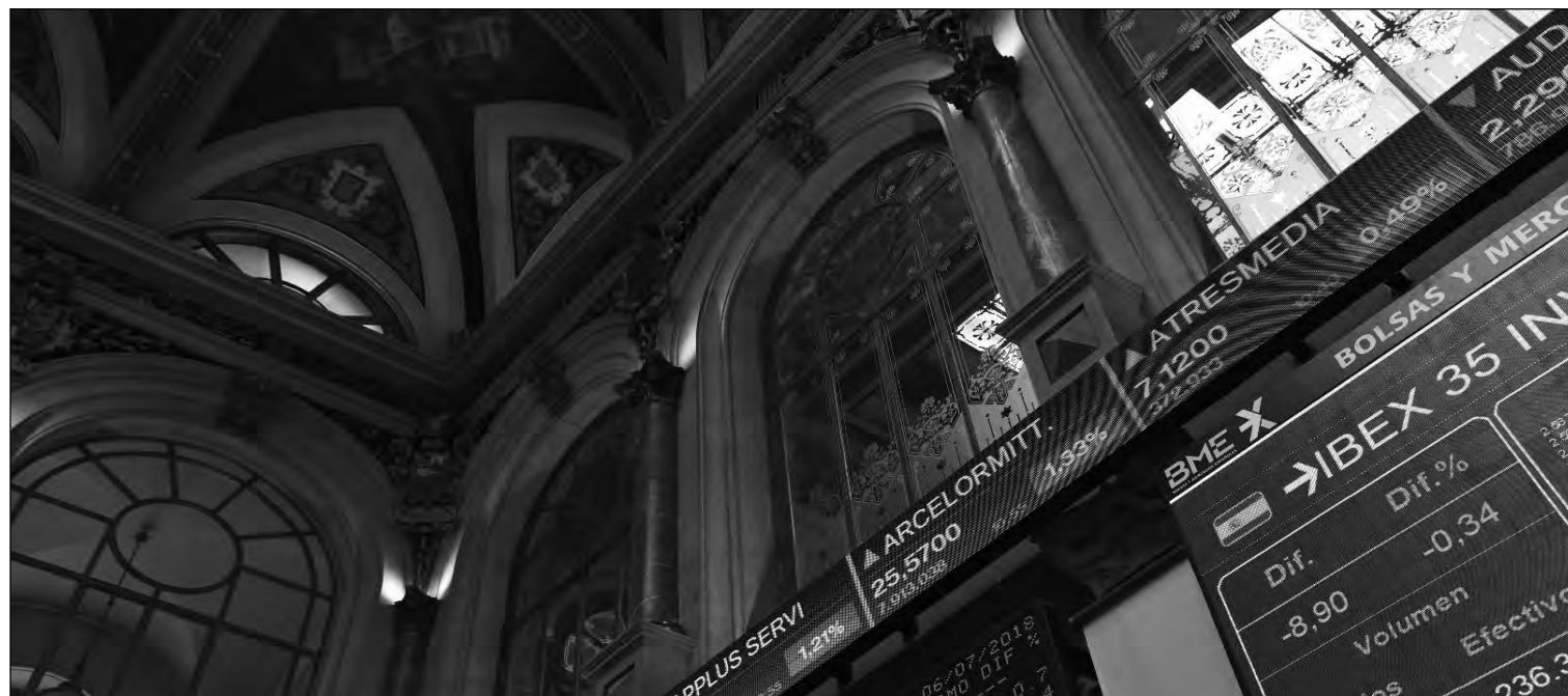
Bolsa de Madrid.

El número de cuentas de partícipes en fondos de inversión se situó en mayo en 11,8 millones, lo que supone un incremento del 1% en el número de partícipes en el conjunto de 2020. Por su parte, los partícipes de sicavs se redujeron un 1,1% en ese periodo, con lo que el total de partícipes de IIC es un 0,7% mayor que a cierre de 2019. La reducción media del volumen patrimonial de las gestoras que comunican sus datos a Inverco fue del