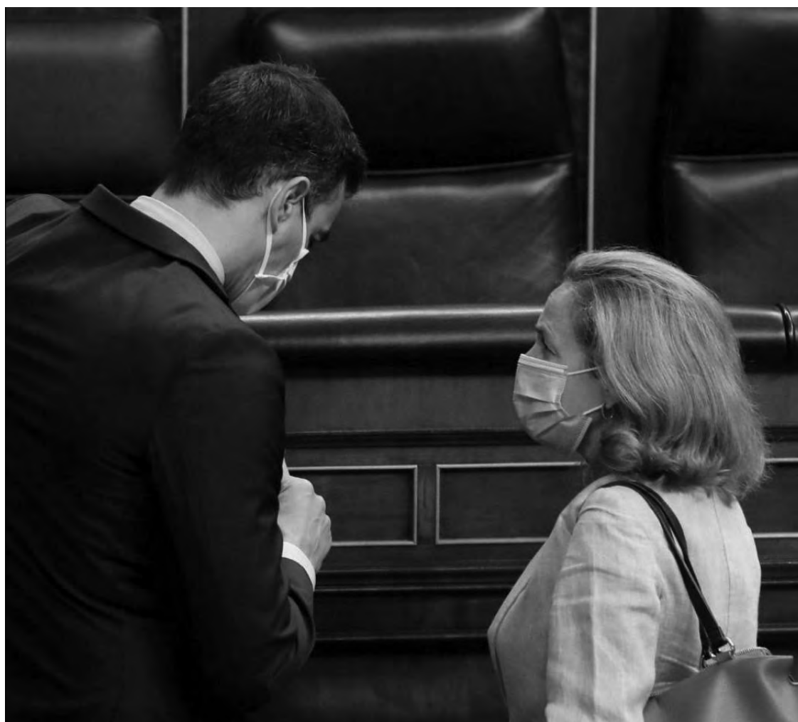
Pedro Sánchez y Nadia Calviño, en el Congreso.

La aprobación de estos nuevos objetivos de estabilidad presupuestaria forma parte de los trámites pre-