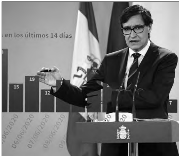
Salvador Illa, ministro de Sanidad, en rueda de prensa.

La información partía del director del Centro de Coordinación de Alertas y Emergencias Sanitarias, Fernando Simón, y el ministro de Sanidad, Salvador Illa.