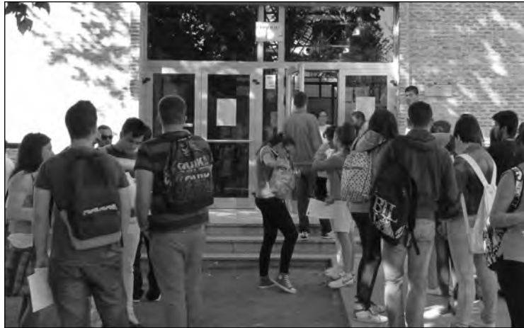
“La prolongación sin límite de edad de la vida estudiantil logrará la formación permanente, con lo cual tendremos las generaciones mejor preparadas de nuestra historia, sin la presión de mendigar contratos basura”.

Al final recluto a un joven estudiante en Ciencias Económicas, a una influencer veinteañera y a un jubilado que toma el sol en el parque. Aviso a