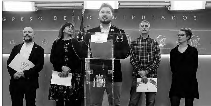
Las fuerzas que facilitaron la investidura de Sánchez encabezan las iniciativas contra la Monarquía en el Congreso de los Diputados.

Desde el PSOE se recuerda que las Cortes no son el sitio para investigar al resto de poderes del Estado, sino la Justicia, precisando que su función es la de legislar y