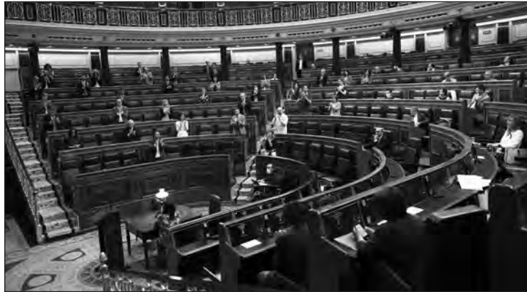
El Congreso de los Diputados ha exhibido una insólita imagen de unidad a cuenta del salario mínimo vital.

Estamos ante el espejismo de la nueva unanimidad del Congreso, es decir, aquella en la que caben todos los partidos, salvo Vox, constituido en "partido antisistema". Y aun así, los de Santiago Abascal se han