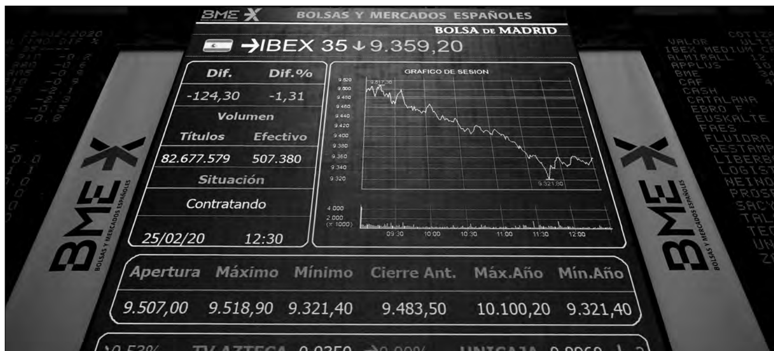
Bolsa de Madrid.

Cada vez son más los inversores que seleccionan los activos de su cartera con criterios que no son únicamente los financieros. Todos valoran que la empresa sea solvente, esté bien gestionada y tenga unas perspectivas de beneficios estables, pero también se empieza a tener en cuenta el impacto en el medio ambiente de la activi-