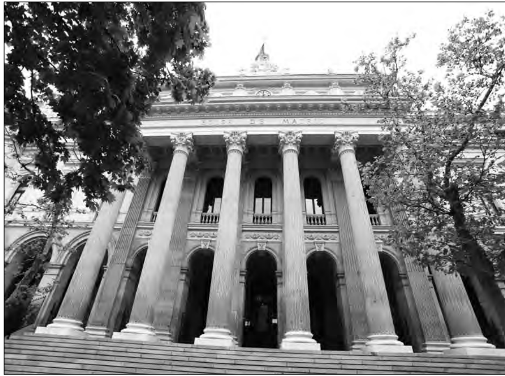
Bolsa de Madrid.

Las acciones entregadas permanecerán inmovilizadas durante tres años, aunque, una vez transcurrido un año y seis meses desde la entrega de los títulos, la compañía desbloqueará una parte en función del desempeño del empleado relacionado con el cumplimiento de objetivos. La entrega de las acciones a cada beneficiario se somete a una condición resolutoria que se entenderá cumplida en los supuestos de baja voluntaria, despido procedente del beneficiario o situación de excedencia. No obstante, si esta excedencia estuviera amparada por la ley para promover la conciliación de la vida familiar y laboral de las personas trabajadoras o para la igualdad efectiva de mujeres y hombres, el período se prolongará por el tiempo que dure dicha situación. "En caso de extinción de la relación laboral entre un beneficiario y su sociedad empleadora por causas distintas de las anteriores, se entenderá cumplido el período de fidelización, salvo que dicha extinción se produjera con el fin de sustituirla por una nueva relación de dicho beneficiario con otra sociedad del grupo PharmaMar", explica la compañía.