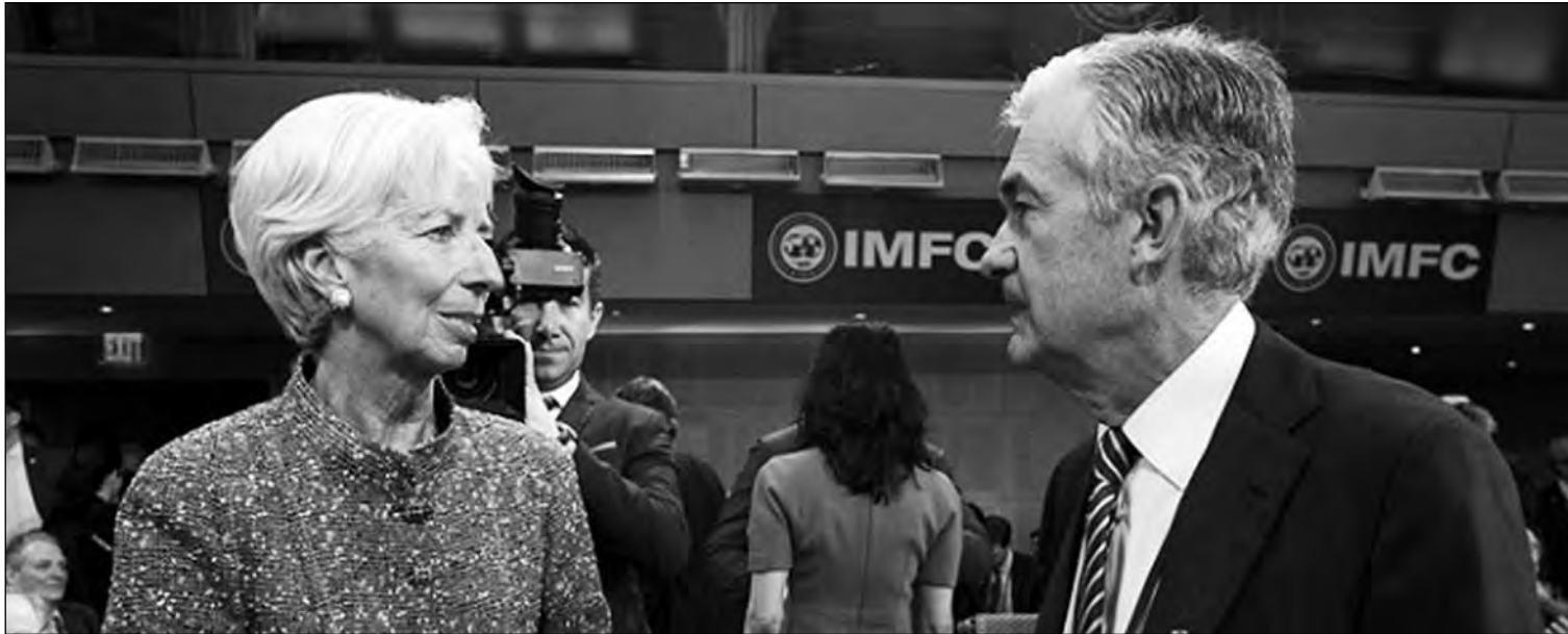
Christine Lagarde y Jerome Powell, presidentes del BCE y de la Reserva Federal, respectivamente.

30-04-20 * En el mercado de materias primas