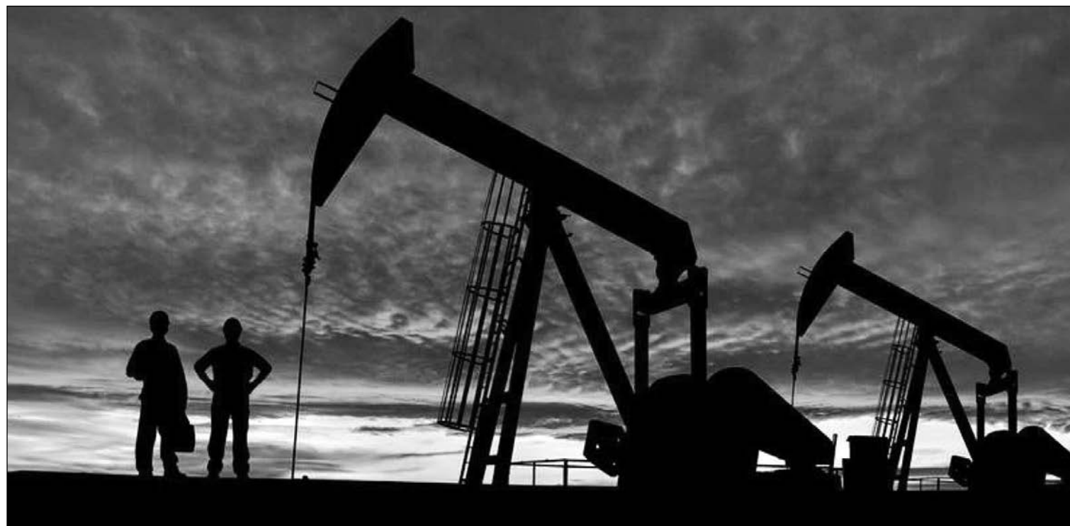
Pozos de petróleo.

07-02-20 *En el mercado de materias primas