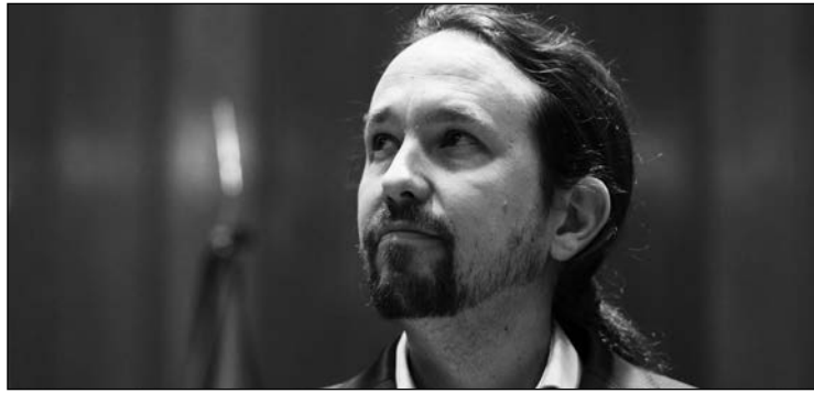
Pablo Iglesias cuestionaba a las pocas horas de su nombramiento la independencia de los jueces.

No se lo podrá fácil la oposición, que ha ya puesto el grito en el cielo tras la designación de la exministra Delgado como fiscal general del Estado , e incluso por el traslado de