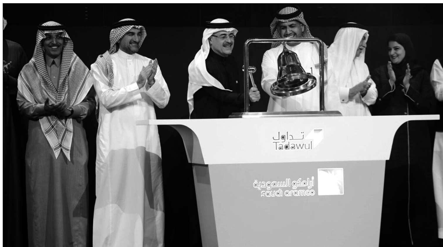
Tadawul, la bolsa de Riad.

Saudi Aramco alcanzó el jueves la valoración de 2 billones de dólares que buscaba el príncipe heredero Mohamed bin Salman, después de que las acciones de la compañía estatal subieran con fuerza en su segundo día de operaciones. El príncipe heredero saudí ha hecho de la