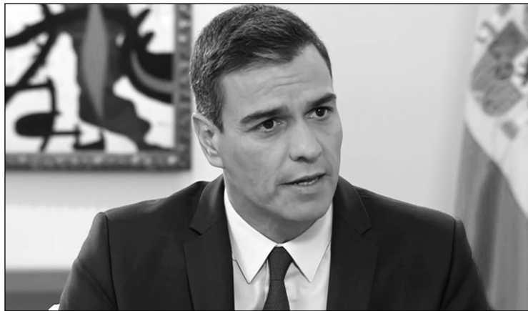
Sánchez ofrece ahora ministerios a Unidas Podemos, pero no a Iglesias.

"La viabilidad de la investidura depende sólo del voto positivo de la formación de Pablo Iglesias, cuyo paso atrás, tras el veto de Pedro Sánchez, facilita la formación del Gobierno. Es el peaje que deberá pagar el candidato por su minoría mayoritaria, con apenas 123 diputados, que se verán sometidos a la difícil negociación de todas y cada una de las iniciativas para legislar. El enfrentamiento y la composición del Congreso alejan cualquier posibilidad de formar un Gobierno alternativo