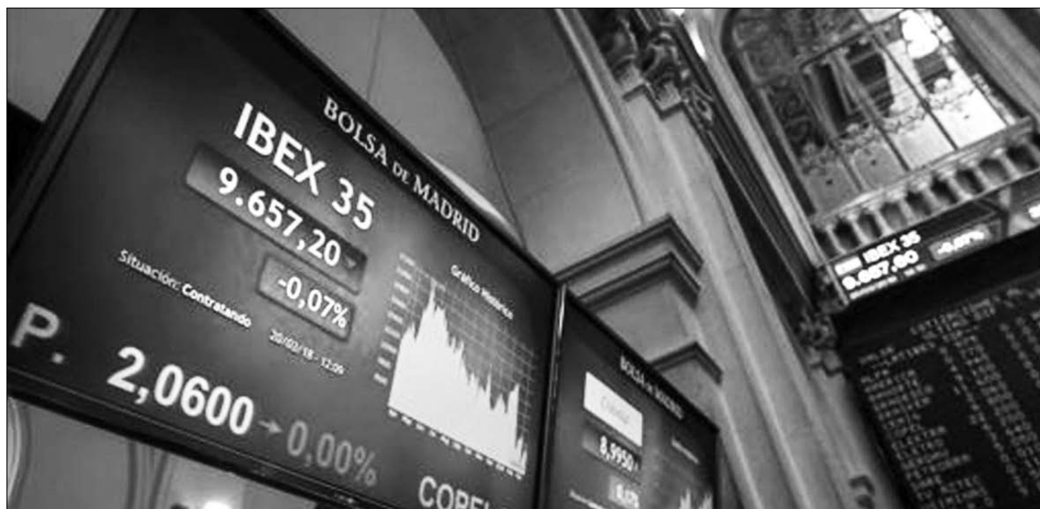
Bolsa de Madrid.

26-04-19 *En el mercado de materias primas