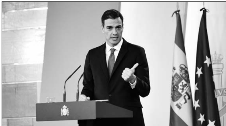
Sánchez responde a la sentencia del Supremo por la vía del decreto.

A la inestabilidad –y la bronca– que cada semana vive el Parlamento se une la conmoción provocada por el Tribunal Supremo tras los efectos de la sentencia sobre las hipotecas que el propio Gobierno y las cámaras legislativas se han comprometido a solventar de manera urgente. Todos los partidos deberán ponerse manos a la obra para cambiar, vía Real Decreto, la normativa que ha provocado convulsión y hasta manifestaciones. La intención es modificar el Impuesto de Actos Jurídicos Documentados (IAJD) de las hipotecas, para que sean los bancos y no los consumidores quienes asuman su pago. Tanto Pedro Sánchez como la mayoría de las