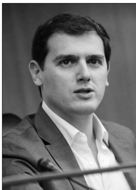
Albert Rivera, presidente de Ciudadanos.