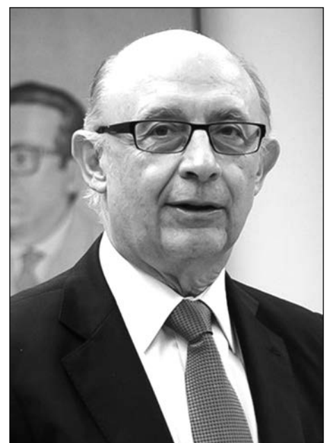
Cristóbal Montoro, exministro de Hacienda.