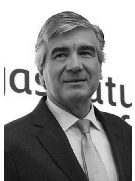
Francisco Reynés, presidente de Gas Natural Fenosa.