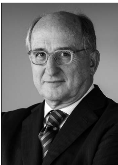
Antonio Brufau, presidente de Repsol.