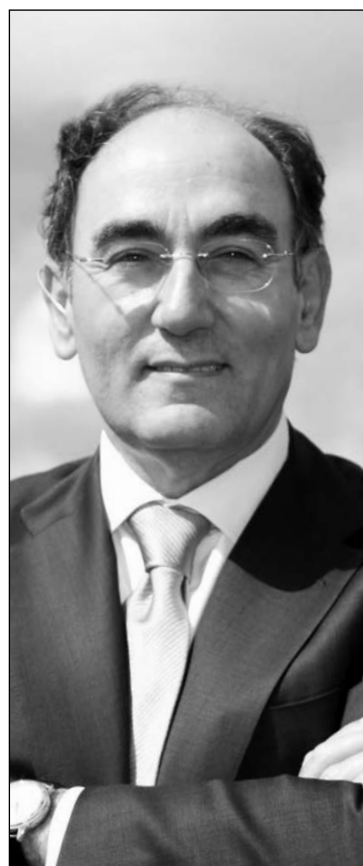
Ignacio Galán, presidente de Iberdrola.