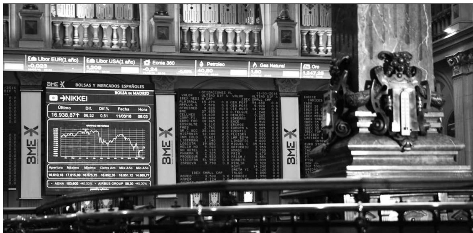
Bolsa de Madrid.

Los 'cortos' han reducido drásticamente sus posiciones en Liberbank, al bajar tras la ampliación de capital desde el 3,18% hasta el 0,54% del capital. El descenso se produce después de que el 21 de noviembre la Comisión Nacional del Mercado de Valores (CNMV) levantó el veto a las posiciones cortas que ha aplicado desde el 12 de