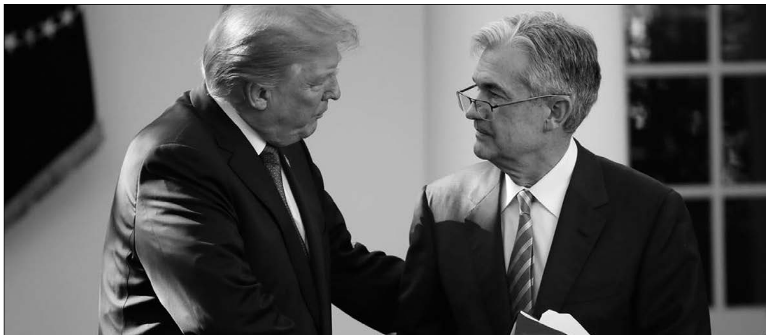
Donald Trump, presidente de EE UU, y Jerome Powell, próximo presidente de la Fed.

08-11-17 *En el mercado de materias primas