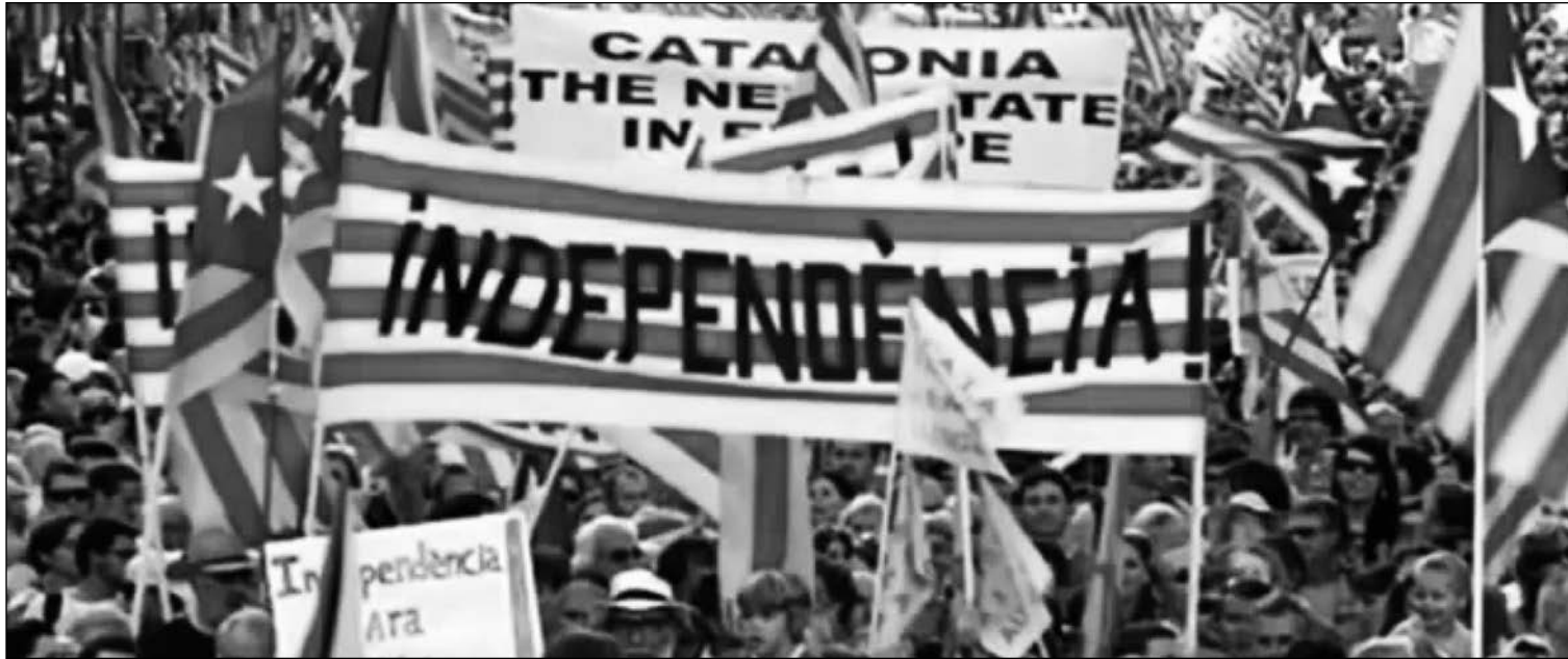
Maniatación a favor de la independencia.

*En el mercado de materias primas 11-10-12