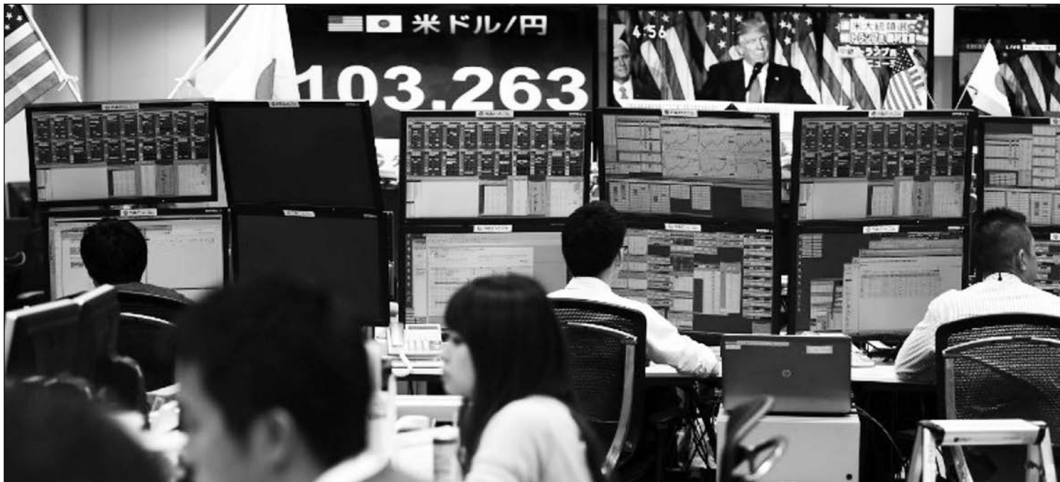
Bolsa de Japon.

El inicio de la crisis supuso el repliegue industrial de multinacionales japonesas como Sony, Honda o Panasonic. Pero el ciclo ha cambiado y la inversión japonesa en España aumentó un 14% en el 2015. Japón es el sexto mayor inversor mundial en términos de stock , pero España ocupa todavía el puesto 30 como destino de la inversión japonesa. Entre los proyectos más recientes de inversión