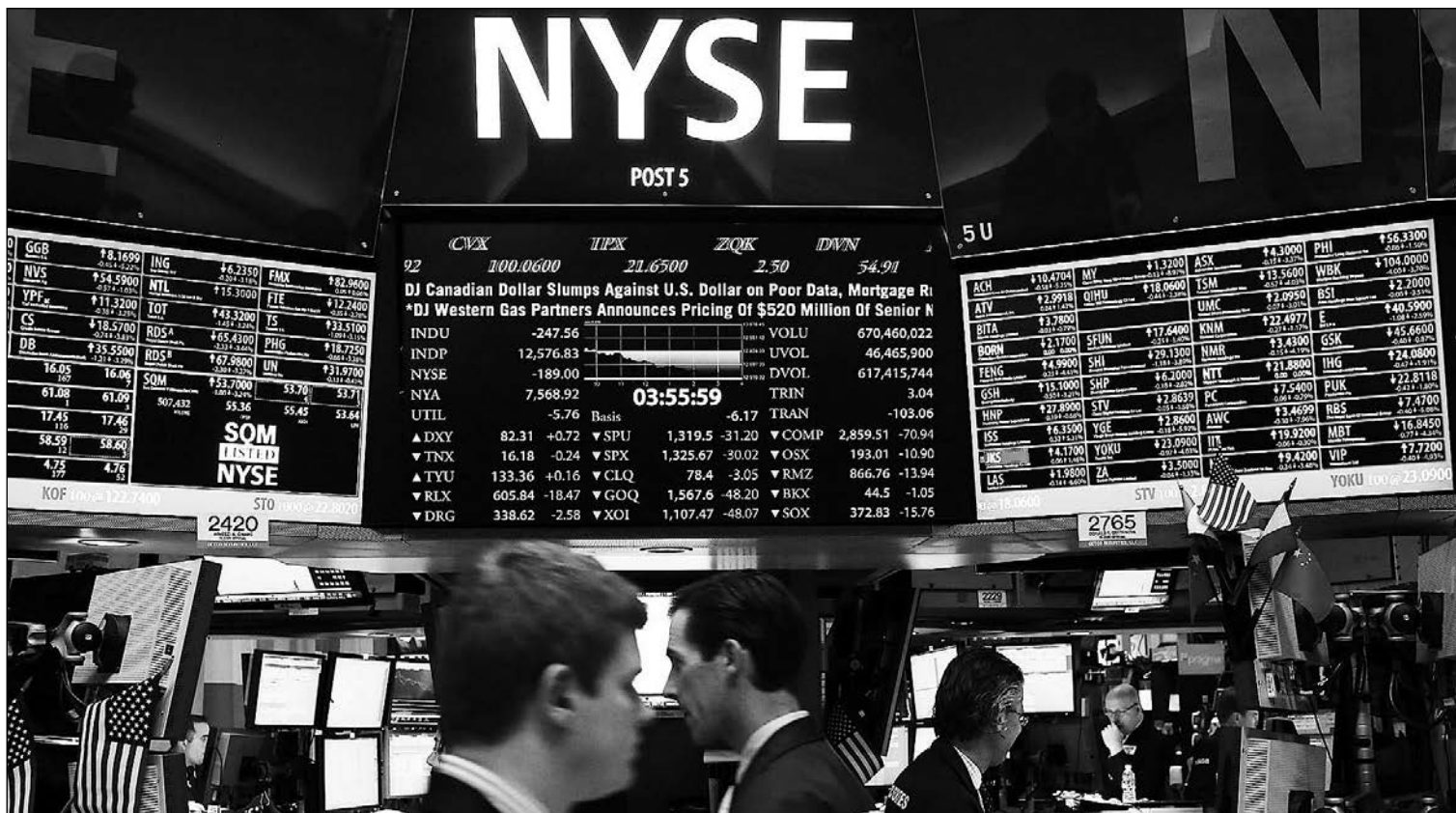
Bolsa de Nueva York.

17-02-17 *En el mercado de materias primas