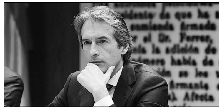
Iñigo de la Serna.

de la capital del Turia, en público, pero parece ser que también en privado. El caso es que el resbalón del que fuera secretario de Estado de infraestructuras ha obligado al ministro de Fomento, Iñigo de la Serna, a aparcar por un rato el principal de sus quebraderos de cabeza, los estibadores, para deshacer el entuerto. Así que en los últimos días, datos en mano e incluso fotografías de las obras entre Tarragona y Vandellós, para los más incrédulos, se ha dedicado a dar explicaciones y a justificar los retrasos de una obra cuya ejecución asciende -asegura- a 13.000 millones de los 17.000 presupuestados.