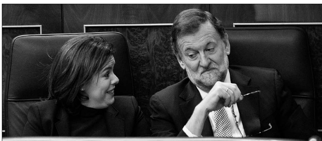
El presidente del Gobierno, Mariano Rajoy, y la vicepresidenta, Soraya Sáenz de Santamaría, en el Congreso.

banco se reserva el derecho a dar por resuelta la operación y exigir la devolución de la totalidad del préstamo, aunque el cliente lleve unos años pagando. Lo que el Alto Tribunal cuestiona no deja de ser, cuanto menos, curioso. Su duda es que, si cuando un enunciado de la cláusula, el relativo al impago de una cuota, se considera abusivo, es posible mantener como válidos los restantes. Es decir, si es posible separar los distintos elementos autónomos de una cláusula con varios enunciados. De declararse nula esta cláusula, el resultado podría ser demoledor para los bancos.