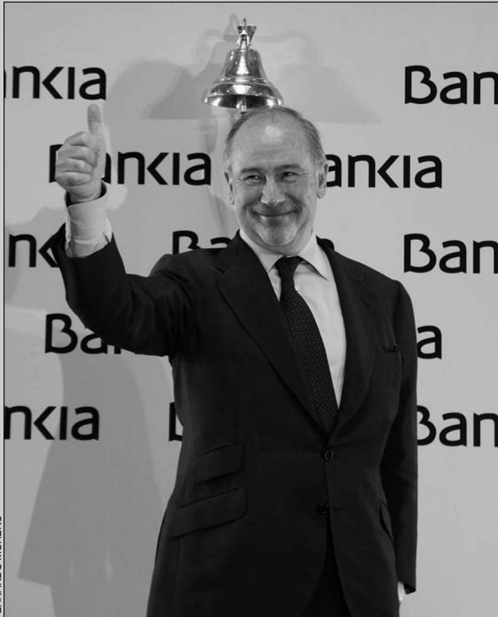
Rato sacó Bankia a Bolsa falseando balances y atropellando a accionistas de buena fe.

Luis de Guindos relata en su libro "España Amenazada", editado en septiembre de 2016 por Península, como las balas le silbaban cuando remitió a la fiscalía del escándalo de las tarjetas black de