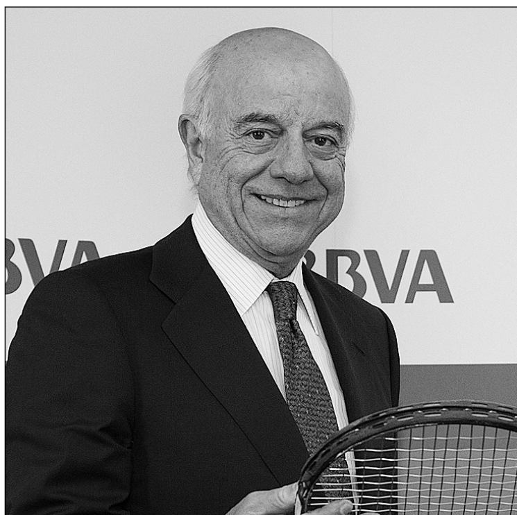
Ana Botín y Francisco González, presidentes de Santander y BBVA, respectivamente.

Todas ganan clientes. Es lo que aseguran las entidades financieras cuando se les pregunta por el número de cuentas o titulares que disponen en España. Pero las matemáticas no salen. Son datos que apenas facilitan los bancos españoles y, cuando lo hacen, es para decir sólo los que han ganado, pero no los que han perdido a manos de la competencia. Es el caso de los dos grandes. Ambos pierden cuentas corrientes y de ahorro, según