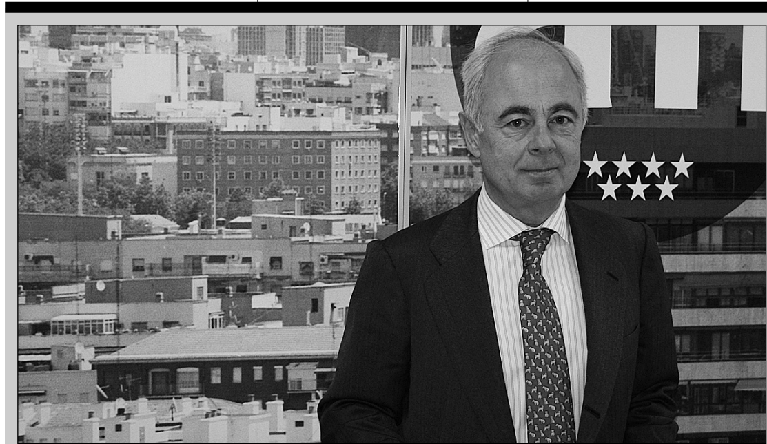
El presidente en funciones de la CNMV, Juan Manuel Santos-Suárez.

Los fondos inmobiliarios del Reino Unido retiran del mercado los edificios que habían puesto a la venta para hacer frente a las peticiones de reembolso, una vez que los inversores han vuelto a invertir de nuevo en el sector. Tras el voto favorable al Brexit , varios fondos pusieron a la venta varios activos, durante el verano, para proporcionar el dinero que los fondos necesitaban devolver a los inversionistas que querían sacar su dinero. Sin embargo, muchos de estos edificios han sido retirados de la venta ya que los flujos de los fondos vuelven a ser positivos. El dinero ha vuelto a los fondos, porque la necesidad de los inversionistas de tener ingresos ha superado a las preocupaciones sobre los efectos de Brexit .