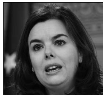
S. Sáenz de Santamaría.

“Es fácil intuir lo que elegiría la militancia socialista, en caso de ser consultada: la mayoría se decantaría por un pacto de izquierdas, aun a sabiendas de los graves riesgos que correría su partido”