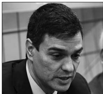
P. Sánchez.

En el equipo que ha rodeado estos dos últimos años a Sánchez no se daba demasiado crédito a las encuestas. Para que se produjera el adelantamiento a manos de la coalición formada por Pablo Iglesias y Alberto Garzón , argumentaban los fieles a Sánchez, Unidos Podemos tendría que hacerse con el 90% de los 22 escaños que se disputaban en una docena de provincias por un número muy reducido de votos. La verdad es que hubo barones regionales que navegaron en la última semana de campaña en el más completo desconcierto, ante la siembra de sondeos que vaticinaban el sorpasso y la cerrazón de Ferraz a admitir la