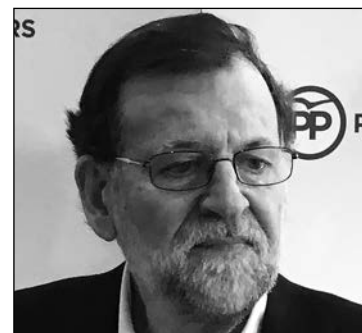
M. Rajoy.

La ecuación más sencilla que se manejaba entre los dirigentes territoriales del PSOE era que sin adelantamiento, Sánchez aguantaría el tirón e intentaría de nuevo acercarse a Podemos, mientras que con sorpasso , la gestora del partido que podría constituirse en la semana siguiente a las elecciones no tendría más remedio que facilitar, abstención parlamentaria mediante, la investidura de Mariano Rajoy .