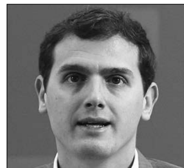
A. Rivera. EP

En todo caso, para que veamos esta posible foto todavía queda un mes, por lo que los socialistas tendrán tiempo suficiente para digerir su prevista derrota. Dentro de Podemos, algunos de sus diputados de la XI legislatura barajaban como hipótesis, en caso de sorpasso , un ofrecimiento generoso al PSOE para cederle la presidencia del Gobierno, eso sí, pactando posteriormente el acceso a todas las áreas sensibles de poder que Pablo Iglesias ya reivindicó después de las legislativas del 20 de diciembre. Gran pesadilla para los socialistas: tener que elegir entre dar el Gobierno al Partido Popular o aliarse con Podemos. Es fácil intuir lo que elegiría la militancia, en caso de ser consultada: la mayoría se decantaría por un pacto de izquierdas, aun a sabiendas de los graves riesgos que correría su