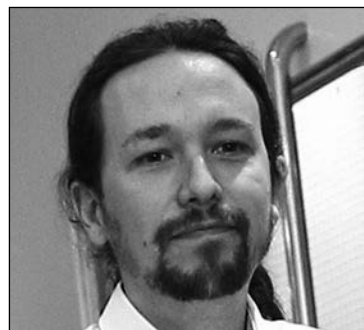
P. Iglesias.

En todo caso, para que veamos esta posible foto todavía queda un mes, por lo que los socialistas tendrán tiempo suficiente para digerir su prevista derrota. Dentro de Podemos, algunos de sus diputados de la XI legislatura barajaban como hipótesis, en caso de sorpasso , un ofrecimiento generoso al PSOE para cederle la presidencia del Gobierno, eso sí, pactando posteriormente el acceso a todas las áreas sensibles de poder que Pablo Iglesias ya reivindicó después de las legislativas del 20 de diciembre. Gran pesadilla para los socialistas: tener que elegir entre dar el Gobierno al Partido Popular o aliarse con Podemos. Es fácil intuir lo que elegiría la militancia, en caso de ser consultada: la mayoría se decantaría por un pacto de izquierdas, aun a sabiendas de los graves riesgos que correría su