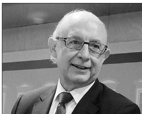
Cristóbal Montoro, ministro de Hacienda y Administraciones públicas, en calidad.