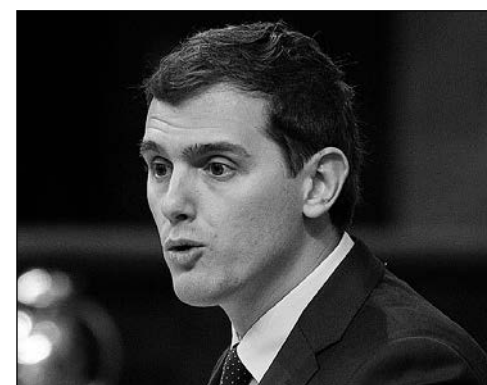
Albert Rivera, Ciudadanos, en calidad y rapidez informativa.