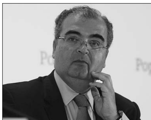
Ángel Ron, presidente del Banco Popular, en accesibilidad.