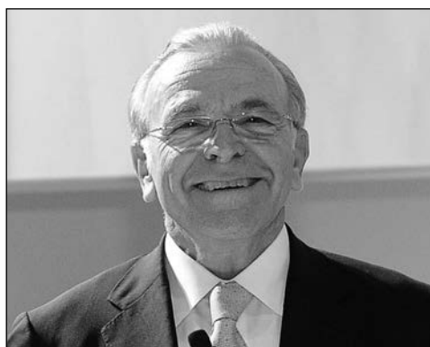
Isidro Fainé, presidente de CaixaBank, en rapidez informativa.