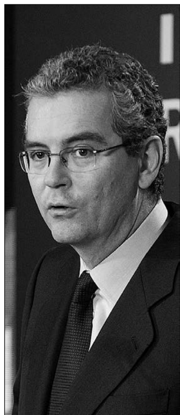
Pablo Isla, presidente de Inditex.