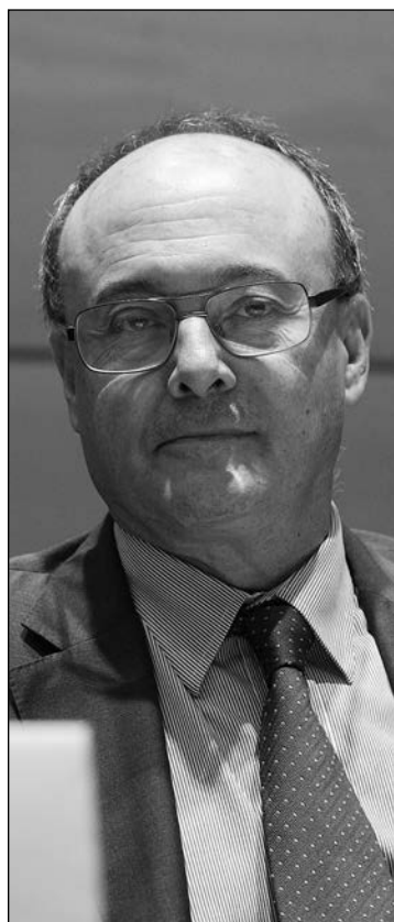
Luis Mª Linde, gobernador del Banco de España.

Por decimoctavo año consecutivo, EL NUEVO LUNES ha realizado también su encuesta entre analistas para evaluar la transparencia informativa y la cantidad, y sobre todo la calidad de la documentación que aportan los bancos y empresas del Ibex-35 así como las empresas de control público a sus Memorias Anuales dando como resultado el 18 Ranking referente a la Información Económica y Financiera y de Memorias Anuales de estos grupos sometidas a votación en nuestro sondeo.