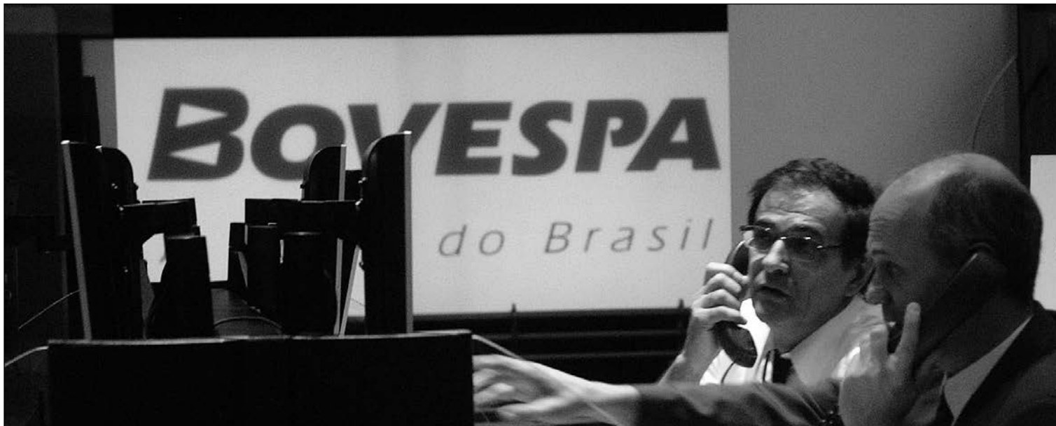
Bolsa de Brasil.

20-05-16 *En el mercado de materias primas