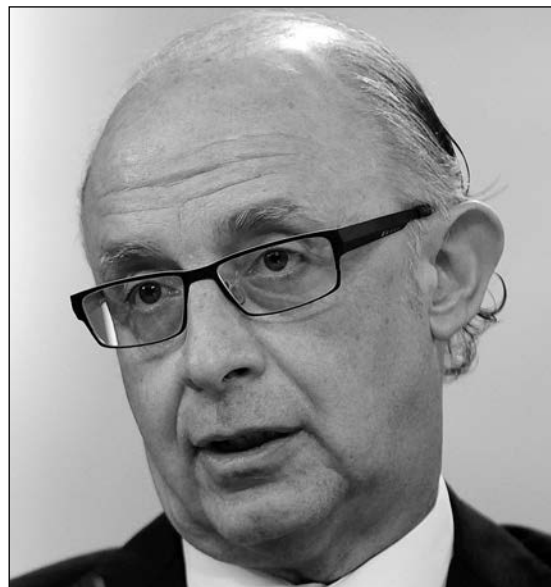
Wolfgang Schäuble y Cristóbal Montoro trabajan sobre las reformas de ambos modelos territoriales.

unos 1.600 millones). La Comunidad Valenciana tendría ingresos extras de medio punto de su PIB, unos 500 millones, mientras que Cataluña obtendría cuatro décimas de su PIB, aproximadamente unos 800 millones. También Murcia saldrían ganando con el reparto alemán. Los que pierden sufrirían un impacto todavía mayor: Cantabria , Extremadura o La Rioja recibirían muchos menos ingresos que en la actualidad.