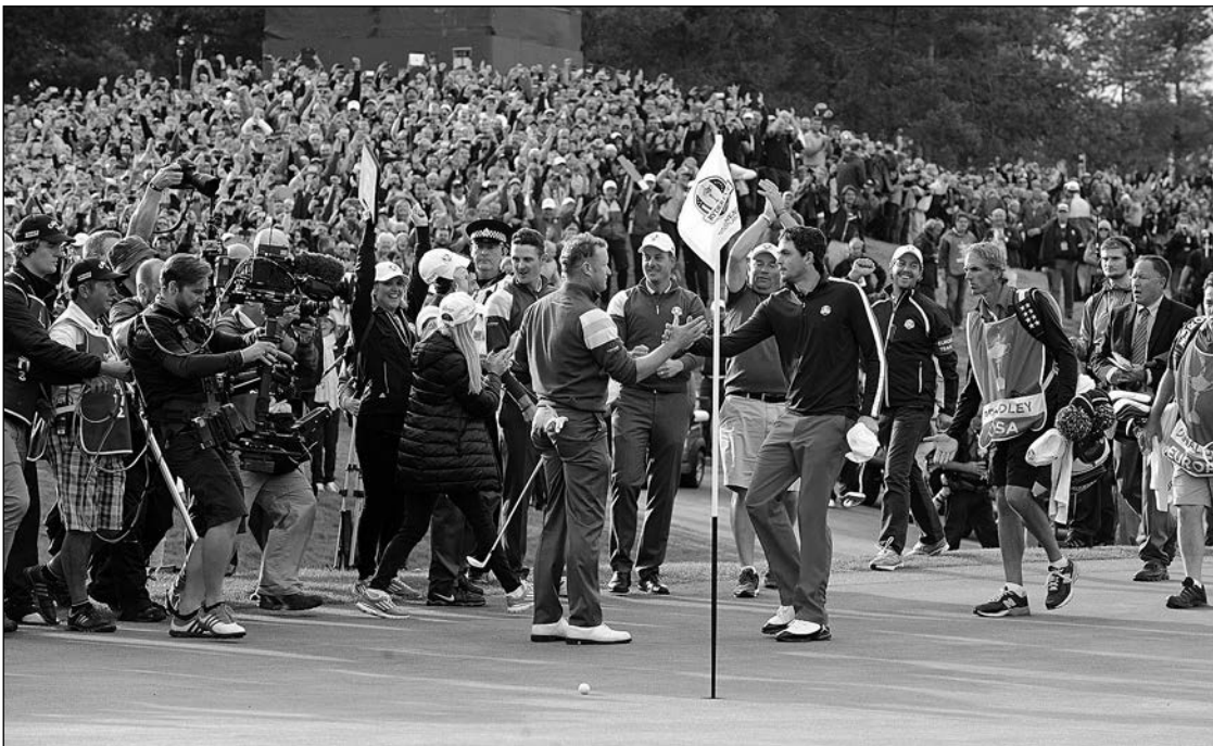
La Ryder Cup no volverá a España en 2022. Su destino será Italia (Roma).