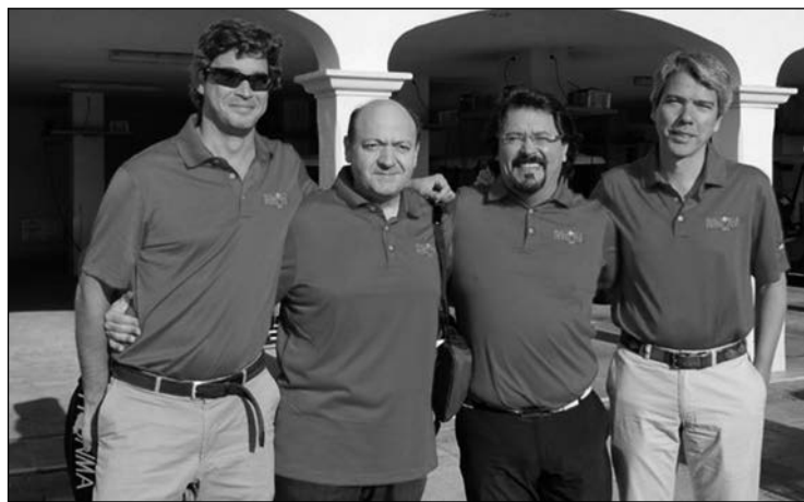
Los miembros del equipo español en Mallorca.

El evento contó con la participación activa de la Fundación Turismo Palma de Mallorca 365, una entidad pública sin ánimo de lucro, de gestión público-privada en materia de turismo y promoción exterior, compuesta por el Ayuntamiento de Palma, de forma mayoritaria, la Autoridad Portuaria de Baleares y 28 empresas privadas, todas ellas de reconocido prestigio y/o líderes del sector turístico a nivel nacional e internacional, con el objetivo de promocionar y fomentar el turismo de la ciudad de Palma de Mallorca y, en este caso concreto, de la isla de Mallorca.