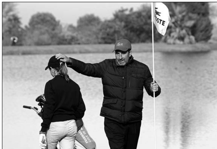
El guipuzcoano sigue disfrutando del golf al máximo.

“No he podido pedir más. Echo la vista atrás y veo a un chaval que se lo pasaba fenomenal pegando a una pelota redonda para divertirse... ¡Hasta dónde ha llegado! Soy muy afortunado. Se han cumplido muchos de los sueños que tenía, algunos que parecían inalcanzables se han hecho realidad. He conocido a mucha gente y he tenido la suerte de codearme con los mejores de este deporte; de todos he aprendido, de los buenos y de los que no han sido tanto. Todos me han enseñado muchas cosas que me han hecho ser mejor. También he aprendido que, a pesar del esfuerzo y el trabajo, no todos llegan arriba; merecen todo mi respeto. Ha sido un viaje largo pero entretenido, ha habido de todo: picos buenos y simas profundas en las que parecía estar en la mayor oscuridad. Ha sido una vida llena de emociones”.