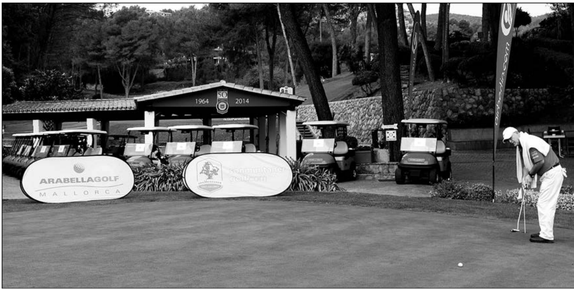
Mallorca sigue siendo un destino turístico de primer orden, por supuesto con el golf como uno de sus grandes atractivos.