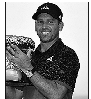
Sergio García volvió a saborear las mieles del triunfo

Todos los citados, a excepción de Shaun Norris, que entregó una tarjeta de 71 golpes, se vieron involucrados en un cuádruple empate a 270 golpes que obligó a disputar el pertinente playoff. En ese momento decisivo Sergio García sacó a relucir su juego más destacado, distinguiéndose como el mejor tras dos hoyos para apuntarse un triunfo que le ratifica como uno de los mejores golfistas del mundo en la actualidad.