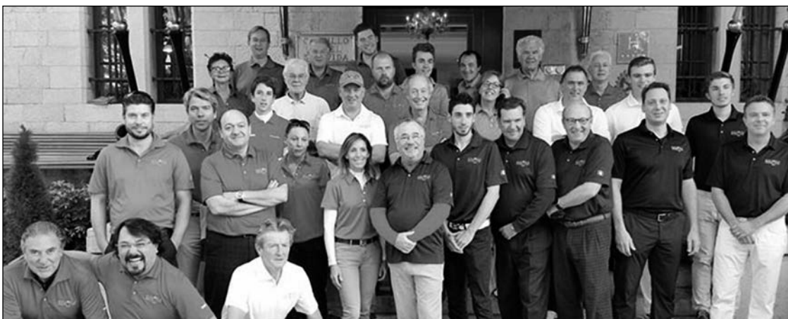
El golf español y su reconocimiento a los que han luchado por este deporte.