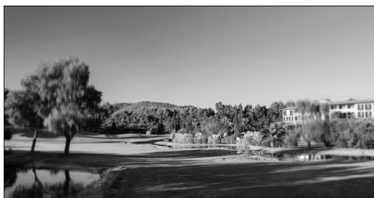
El recorrido de Son Vida albergó una nueva edición de la Mallorca Press Cup.

P eriodistas de toda Europa se han dado cita en el Castillo Hotel Son Vida, en Mallorca, en la séptima edición de la Mallorca Press Cup, en un encuentro ya clásico que ha servido para confirmar el destino turístico y de golf de la isla. El Castillo Hotel Son Vida ha sido por séptimo año consecutivo el cuartel general de los equipos de periodistas de toda Europa. Británicos, alemanes, belgas, franceses, holandeses, italianos, nórdicos, y un equipo balear, además del tradicional conjunto español, han disputado la VII edición de la Mallorca Press Cup en dos días de competición.. P4