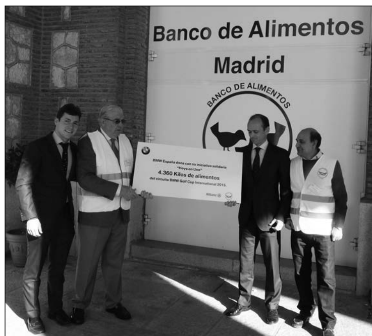
El golf, una vez más, un deporte muy solidario.

■ Un año más, los participantes de las diez pruebas de la BMW Golf Cup International han mostrado su lado más solidario aportando su granito de arena a la iniciativa benéfica a favor del Banco de Alimentos promovida por la marca bávara y Allianz Seguros. En esta edición de 2015 la acogida ha sido todavía mayor que el pasado año, cuando se inauguró esta acción, y se ha conseguido una recaudación de más de cuatro mil euros. Esta iniciativa de responsabilidad social corporativa consiste en una donación de diez euros a cambio de una segunda oportunidad para participar en el concurso más popular del circuito, el concurso "Hole in One" cuyo premio en esta edición era un flamante Serie 2 Active Tourer. Este concurso, patrocinado por Allianz Seguros, está presente en todos los torneos del circuito incluida la final nacional, y consiste en embocar la bola de un solo golpe en uno de los hoyos designado en cada recorrido por la organización. Por el momento, y pese a la segunda oportunidad a la que han accedido más de 400 jugadores en esta edición, ningún participante ha logrado hacerse con las llaves del BMW en toda la historia de la BMW Golf Cup International de España.