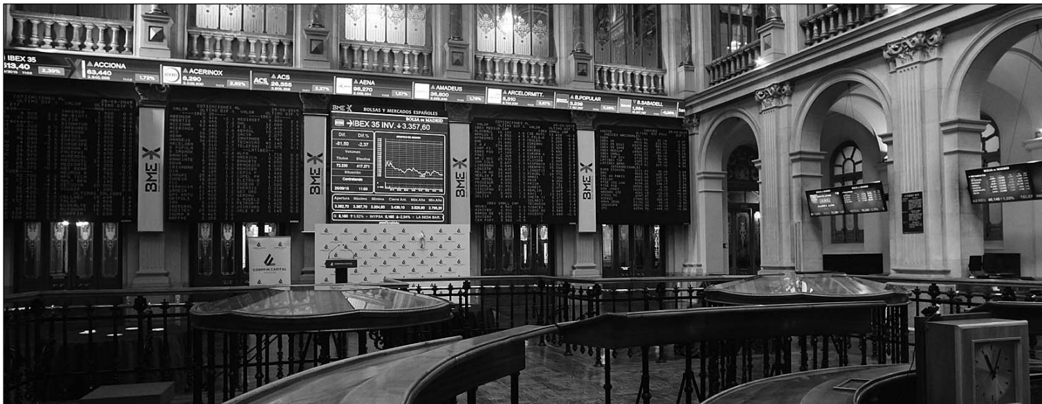
Bolsa de Madrid.

* En el mercado de materias primas 09-10-15