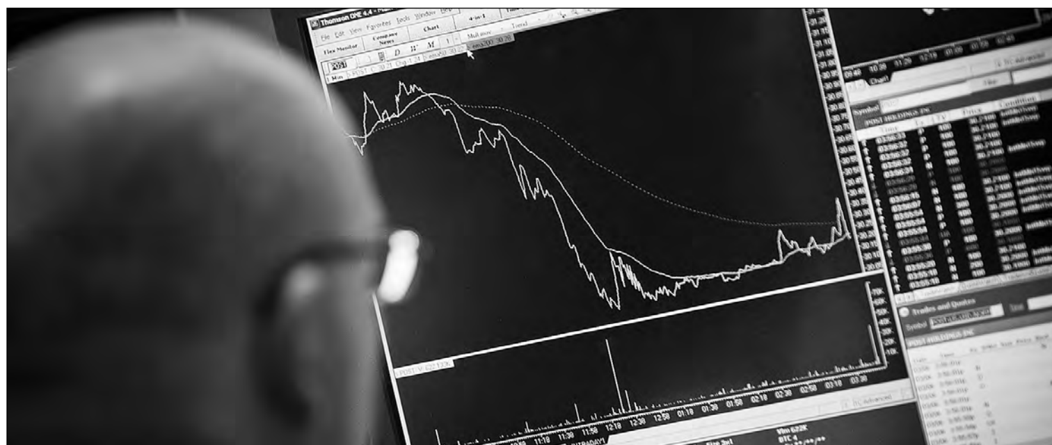
Bolsa de Madrid.

Durante muchos años los brókers en España han mantenido cierta tranquilidad en los servicios ofrecidos. Sin embargo, esa calma se rompió hace un año. El primero en abrir fuego fue DeGiro, que aterrizó en España con la intención de romper el mercado, ofreciendo al inversor minorista unas comisiones para operar en Bolsa muy