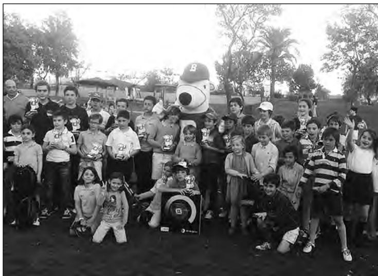
Los niños con el protagonista del torneo, el Oso Bogey.