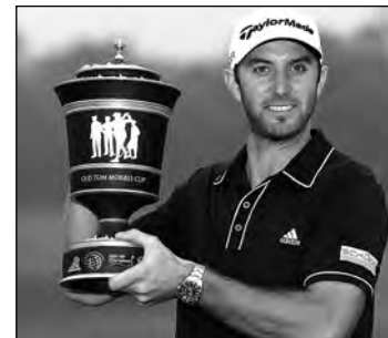
Espectacular victoria de Dustin Johnson.

El norteamericano firmó una tarjeta de 69 golpes, tres bajo par con cuatro birdies y un sólo bogey que le dejaron con un menos nueve suficiente para terminar en el dieciocho con el par y terminar con la victoria y da la sensación que volviendo a poner normalidad en una carrera en la que siempre fue un jugador excelente.