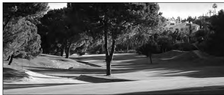
Los campos de golf de la Costa del Sol prevén un aumento de ocupación este año.

que ya ha sido considerado con diferencia como el mejor en golf desde 2009”, aseguran desde la Asociación Española de Gerentes de Golf. P3