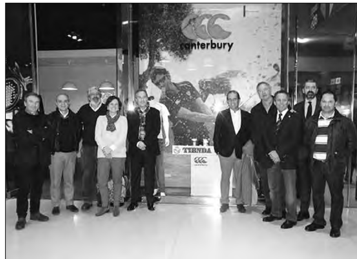
La nueva Junta Directiva de la Federación Gallega de Golf.

Posteriormente todos los responsables federativos se trasladaron a la nueva Tienda Oficial de la Federación Gallega de Golf ubicada en el Centro Comercial Coruña The Style Outlets, donde pudieron ver los artículos de merchandising y la nueva ropa y complementos de la marca Canterbury que llevará el logo de la Federación Gallega de Golf, todo ello en el marco de una nueva etapa repleta de proyectos con la firme intención de hacer del golf un deporte de referencia en Galicia.