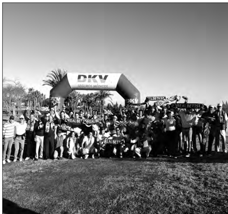
Los integrantes de los equipos en la foto de familia del Copa Sevilla-Betis.

■ La segunda edición de la "Copa Sevilla-Betis" organizada por el Real Club de Golf de Sevilla, el equipo vencedor ha sido este año el integrado por los seguidores del Sevilla (21 puntos a 10). En la primera edición organizada el pasado año ganó el equipo del Betis. En esta ocasión, han participado 124 jugadores. 31 parejas representando al Betis se enfrentaron en formato Match Play (doble mejor bola) a 31 parejas representando al Sevilla, con resultado final de 21 a 10 a favor de los del Sevilla. Los socios disfrutaron de un gran día con extraordinario ambiente y con un merecido cocido andaluz como premio y colofón durante la entrega de premios y sorteos de regalos para todos los participantes.