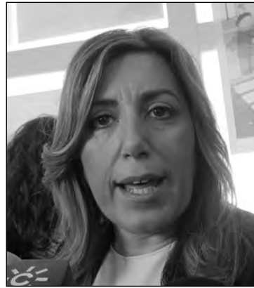
S. Díaz. EUROPA PRESS

Lo que es incuestionable es que el presidente del Gobierno ha comenzado a exponer el relato de su política económica y que los argumentos que ha esgrimido en