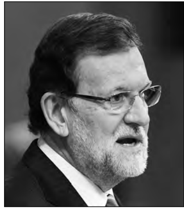
M. Rajoy. F.M.

A medida que pasa el tiempo, crece la sensación de que Susana Díaz no se atreverá a dar el doble salto mortal dejando su feudo andaluz y arriesgando a quedarse sin nada. Pero hay también opiniones dentro del PSOE que apuntan a que no actuará a través de intermediarios y, si el batacazo es sonoro en los comicios de mayo, estará a la altura de las circunstancias. En todo caso, lo que revelan todas estas especulaciones es que el debate del estado de la nación no le ha servido a Pedro Sánchez para afianzarse al frente del timón de Ferraz. Es difícil decir quién ganó el debate y quién lo perdió. Sus más fieles aseguran que laminó a Rajoy haciendo que cale el mensaje de que España tiene un presidente del Gobierno alejado de la calle. Sus menos leales, que también conviven en la misma Ejecutiva, creen que a Sánchez todavía le falta un hervor y que cometió errores de novato al no ser capaz de construir un discurso sustentado por un mensaje con fuerza. Lo cierto es que Rajoy sí ha dejado contenta y satisfecha a toda su tropa y que el líder socialista ha repartido la emoción por barrios de manera desigual.