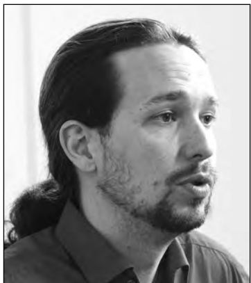
P. Iglesias. F.M.

“Si algo ha demostrado el Debate sobre el estado de la Nación es que los socialistas siguen teniendo todavía mucho fondo de armario, en el que caben todos los errores cometidos por el último Gobierno de Zapatero”