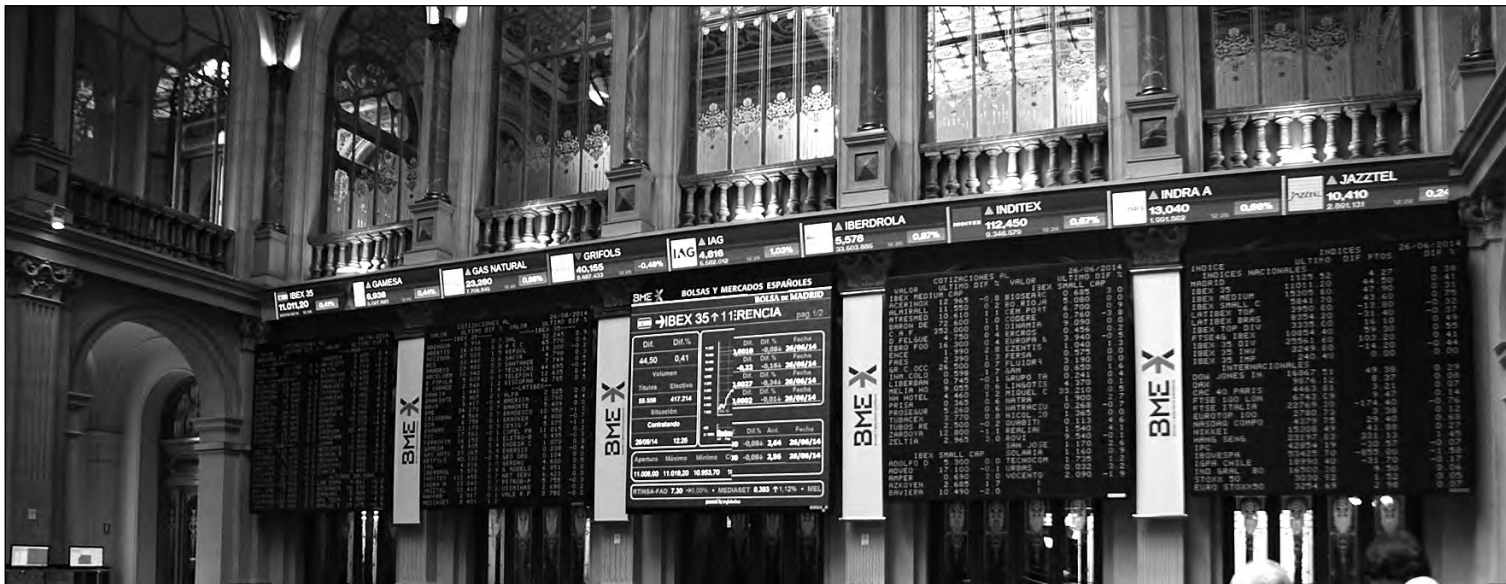
Bolsa de Madrid.