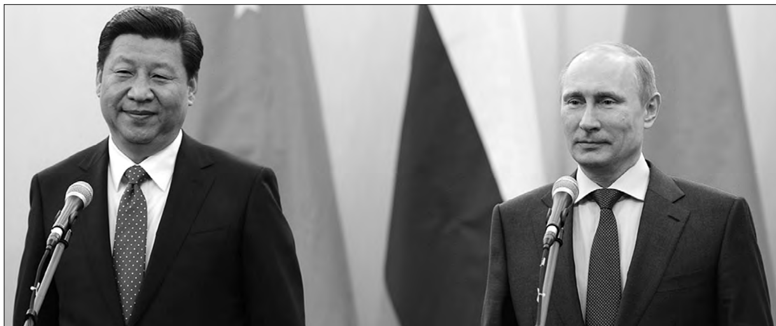
Los presidentes de China, Xi Jinping, y su homólogo ruso, Vladimir Putin, sellan el mayor acuerdo gasístico de la historia.

20-06-14 *En el mercado de materias primas