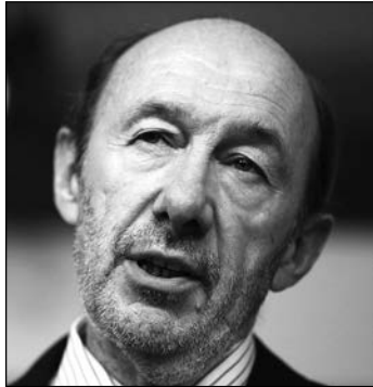
A. Pérez Rubalcaba.