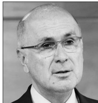
J. A. Duran i Lleida.

La crisis política abierta en Cataluña y el desafío soberanista al que se enfrenta el Estado van para largo. Es la opinión de la