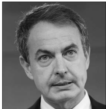
J. L. Rodríguez Zapatero.

independencia. El guion del PP pasa por no mover ficha dado el nulo margen que tiene en estos momentos Mariano Rajoy para dar más dinero a Cataluña o para concederle algún favor llegado el momento de alumbrar un nuevo sistema de financiación autonómica. Por último, Rubalcaba no quiere oír hablar de otra cosa que no sea la reforma de la Constitución para encajar en ella lo que el propio Tribunal Constitucional dejó fuera del Estatuto cuando gobernada José