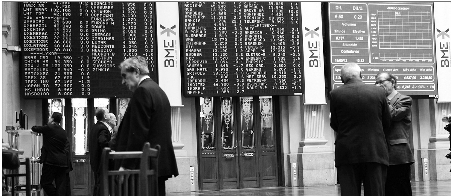
Bolsa de Madrid.

* En el mercado de materias primas 18-10-13