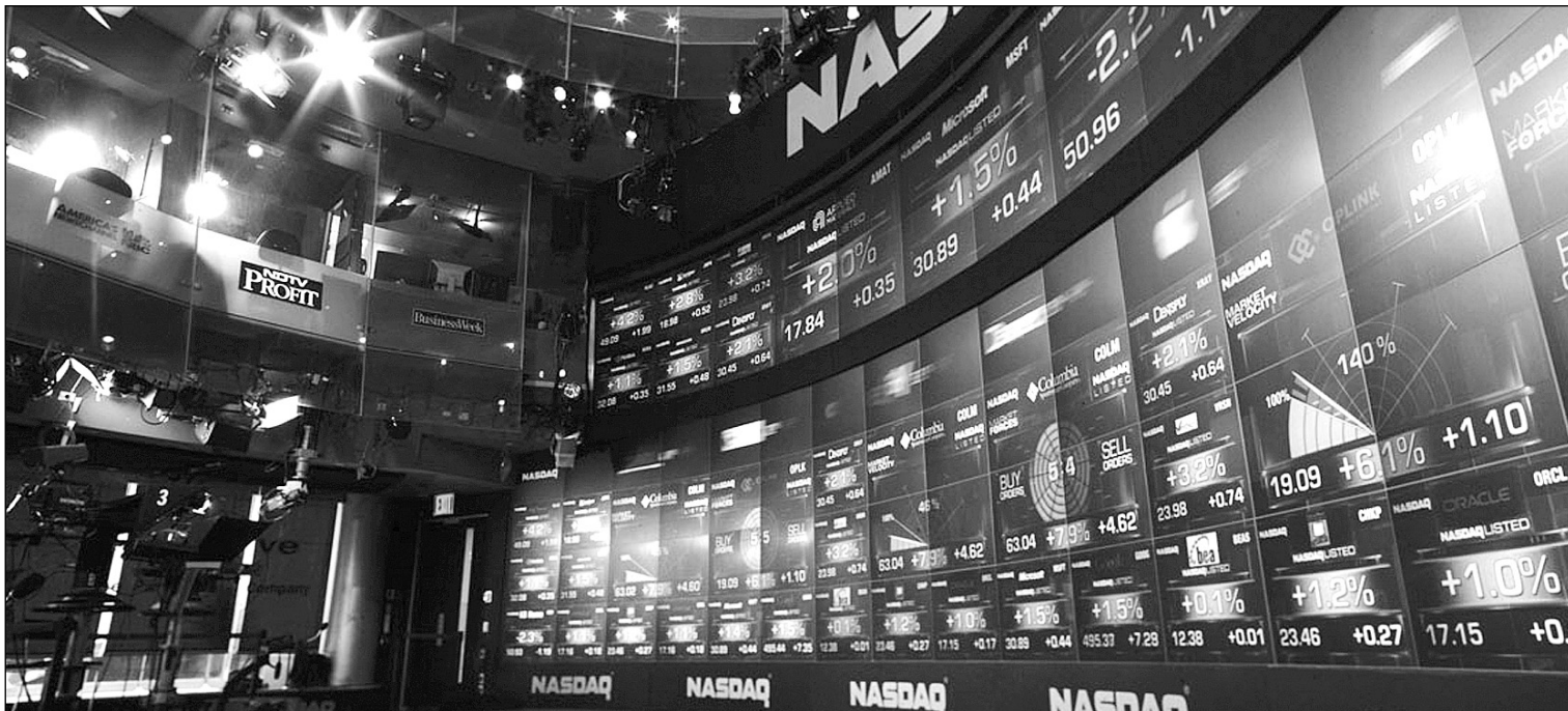
Bolsa de Nueva York.

13-09-13 * En el mercado de materias primas