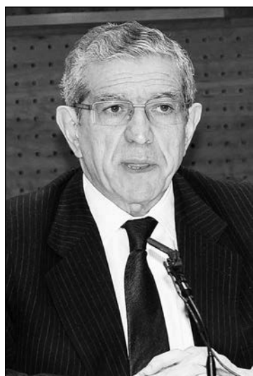
Braulio Medel, presidente de Unicaja.