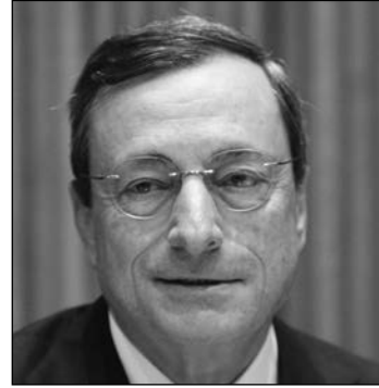
M. Draghi.

su despacho una llamada del líder del PSC se echa a temblar, ya que no es un dirigente territorial al uso. En estos momentos, al PSOE le vendría muy mal un cisma en el PSC pues el bueno de Ramón Jáuregui tiene prácticamente ultimado el documento que haría posible prolongar la convivencia entre las dos organizaciones bajo un modelo federal que incluiría la reforma de la Constitución. Un