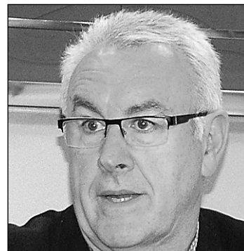
C. Lara. E. P.

“La crisis económica lo ha eclipsado casi todo y pudiera suceder, aseguran en el Gobierno, que los indicadores que anticipan la recuperación hagan sombra también al resto de los graves problemas que tiene España”