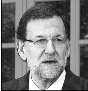
M. Rajoy.

tal y como está la investigación del 'caso Bárcenas', pues todavía quedan por conocerse varias comisiones rogatorias enviadas a Suiza que pueden dejar los 47 millones encontrados hasta ahora en las cuentas del extesorero en una mera limosna.