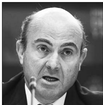
L. de Guindos.