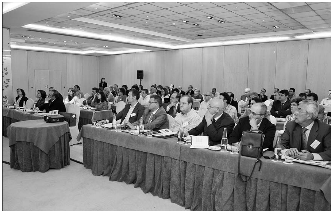
Los asistentes a la Jornada escucharon atentamente las intervenciones de los ponentes.

Sobre su incidencia directa en el PIB, el informe de la Universidad