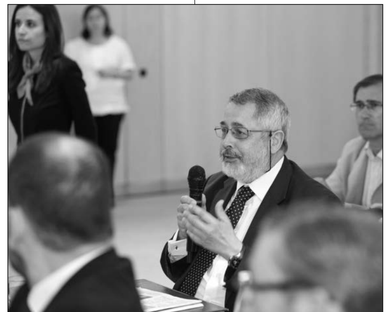
Los asistentes a las jornadas participaron activamente en los debates.