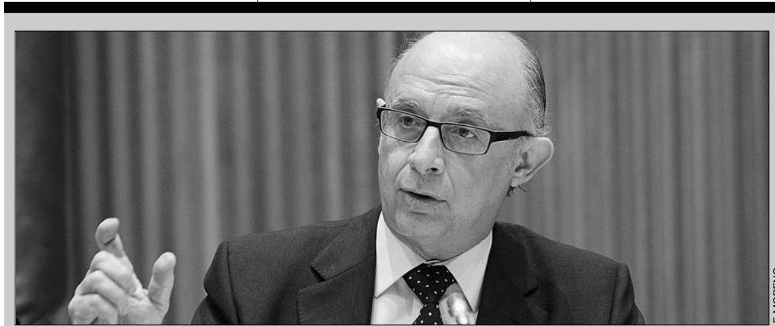
Montoro ha protagonizado el último desencuentro con un redactor del diario en un curso de la APIE en Santander.

La CEOE, liderada por Juan Rosell, piensa que el anteproyecto de ley de Cámaras no resuelve el entendimiento obligado entre las propias cámaras y las organizaciones empresariales. La patronal está preocupada porque cree que el Gobierno ha reformado la ley para que todo quede como estaba y no termina de definir como se tiene que articular, o al menos manejar, la duplicidad de funciones entre ambas instituciones. Por eso quiere que el texto pase por el Consejo Económico y Social donde la patronal puede tener más fuerza.