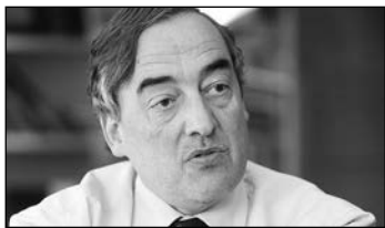
J. Rosell. F. M.

El diseño de la nueva Comisión Nacional de los Mercados y la Competencia está a punto de culminar y el superorganismo, de ver la luz. Eso sí, envuelto, desde el principio, en la polémica. Desde los que no ven el sentido a la fusión, ni por costes, ni por funcionamiento, hasta los que creen que se resentirá, precisamente, su principal objetivo, la competencia. Ahora, surgen además dudas sobre el ahorro prometido porque todo parece indicar que está previsto en sus Estatutos que el Consejo pueda ser ayudado por un 'cuerpo de asistencia', para el apoyo en la gestión de trabajos y 'realización de las funciones de confianza o asesoramiento especial no reservadas a funcionarios de carrera'. Si bien, ahora también existe esa figura del asesor, algunas fuentes creen que esta figura corre el riesgo de potenciarse y politizarse más.