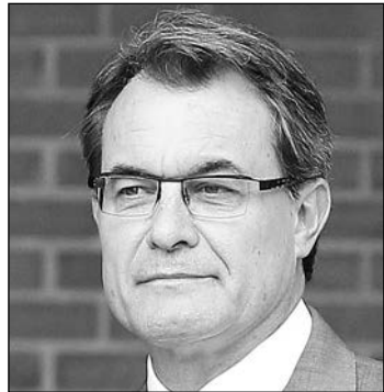
A. Mas. F. M.

Los diputados de la comisión de gastos reservados son conscientes, pues, de que han asistido a un paripé, algo evidente si se tienen en cuenta las preguntas que Cayo Lara , en representación de Izquierda Plural, le ha dirigido al Gobierno, entre otras, si la princesa Corinna ha recibido pagos en el extranjero a través de cuentas abiertas por el CNI en paraísos fiscales. Es fácilmente imaginable la respuesta que el Ejecutivo va entregarle al Congreso, como también lo es el deterioro de imagen que va a seguir sufriendo la Corona si don Juan Carlos no controla mejor sus amistades. Pero este es un asunto que preocupa lo