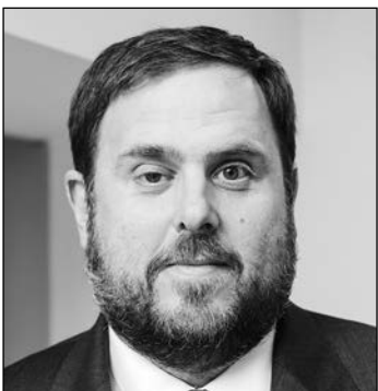
O. Junqueras.

(Esquerra Republicana) sigue negándose a amparar unos Presupuestos que abocan a la Generalitat a un recorte próximo a los 4.000 millones de euros para este año. Artur Mas espera como agua de mayo que Bruselas relaje los objetivos de déficit para que el ministro Cristóbal Montoro reparta su generosidad en 17 porciones y los ajustes pendientes no sean tan despiadados. El Consejo de Política Fiscal celebrado a finales de la semana pasada, puede contribuir a que las relaciones entre los dos gobiernos mejoren y a que el consejero Andreu Mas-Colell celebre con Luis de Guindos su supervivencia, pues es uno de los pocos ministros con los que mantiene una relación cordial. Los nacionalistas catalanes han puesto en su lista negra al titular de Hacienda, a pesar de que es el único que les puede dar cuerda siempre que renuncien a la gran incoherencia que supone construir