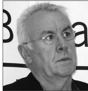
C. Lara. E. P.

un Estado propio sirviéndose, precisamente, del dinero del Estado del que se quieren divorciar. ¿Un Estado propio construido con el dinero de todos los españoles? En Cataluña se respira aire de cambios.