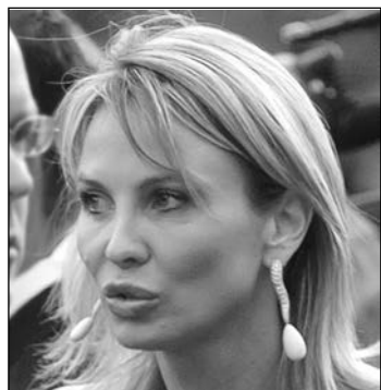
La princesa Corinna.

Los diputados prestan atención, por ejemplo, al posible descarrilamiento que, sin que intervengan los servicios de información, puede sufrir el proyecto soberanista de CiU en Cataluña si Oriol Junqueras