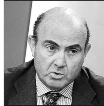
L. de Guindos.

Pero es evidente que Rajoy no está por la labor de abrir una guerra con Cataluña. Lejos de la estrategia que seguiría José María Aznar , el presidente del