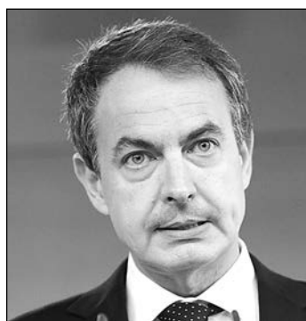
J. L. Rodríguez Zapatero.