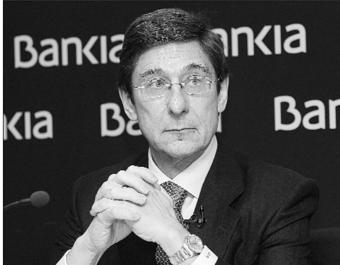
Ignacio Goirigolzarri, presidente de Bankia.