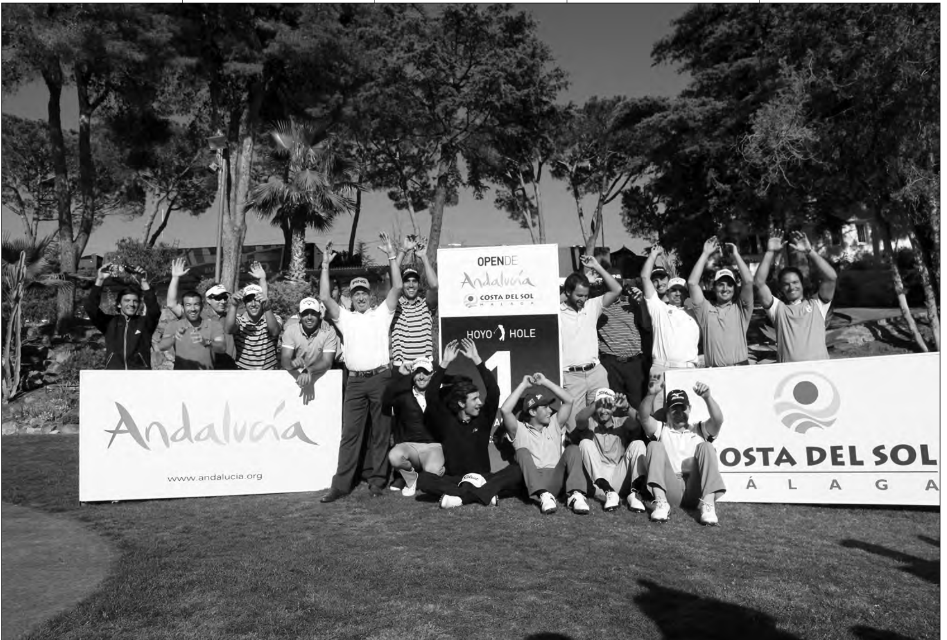
Imagen de los españoles participantes en el Open de Andalucía 2012.

Suplemento semanal del mundo del Golf – N.º 761