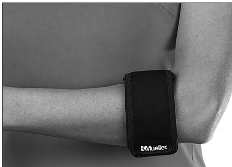
El codo de tenis o de golf (Epitrócleitis), es otra de las lesiones habituales en los jugadores de este deporte.

Según establece el reglamento, cada país participante presenta un equipo masculino compuesto por 4 jugadores y otro femenino formado por 3 jugadoras, cuyos resultados diarios -los tres mejores en el caso de los chicos; los dos mejores en el caso de las chicas- son computados para establecer la clasificación. La competición se celebra bajo la modalidad "stroke play" (juego por golpes) a lo largo de los cuatro días que dura la prueba. Paralelamente a ésta se disputa la competición individual.