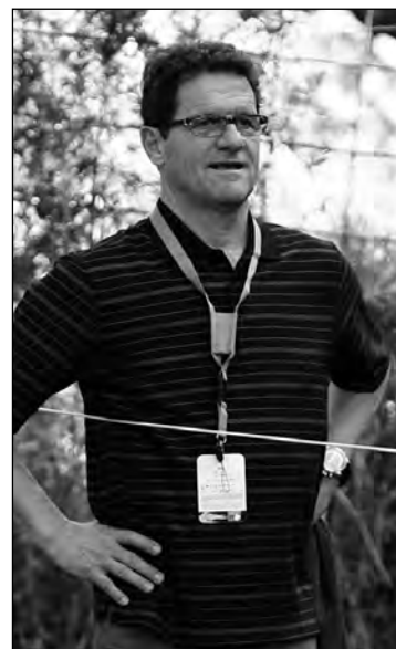
El exseleccionador de Inglaterra, el italiano Fabio Capello, presenciando en directo el torneo.