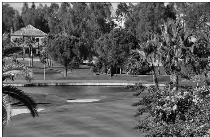
El Real Club de Golf de Sevilla acogerá por tercera vez el Open de España de Golf.

■ Las principales instituciones que representan a las empresas turísticas de Sevilla se han dado cita en el Real Club de Golf de Sevilla con vistas a la celebración del próximo Reale Seguros Open de España 2012, que tendrá lugar en las instalaciones del club sevillano del 3 al 6 de mayo. Los asistentes al encuentro recibieron información de primera mano de los preparativos del Reale Seguros Open de España, que de nuevo regresa este año al Real Club de Golf de Sevilla. Los representantes de las distintas instituciones turísticas sevillanas respaldaron la celebración de este prestigioso torneo, coincidieron en resaltar la importancia para la imagen y el turismo sevillano de eventos de tanta proyección internacional y destacaron la relevancia que supone para la economía sevillana en los días de su celebración.