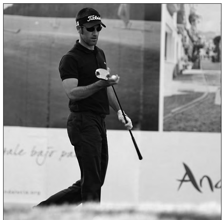
De la Riva se quedó a un paso de su primera victoria en Europa, aunque hizo un gran torneo y terminó tercero.