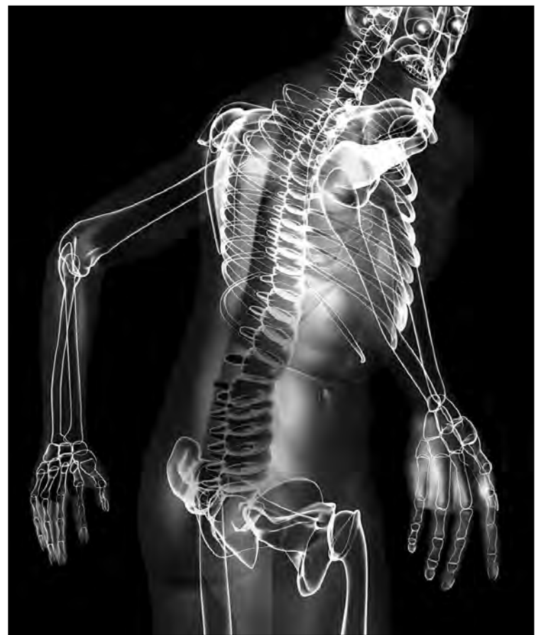
La espalda, una de las zonas del cuerpo que más sufren los jugadores de golf.

La Unidad de Fisioterapia de HC Marbella recomienda realizar un correcto calentamiento de las articulaciones antes de comenzar a