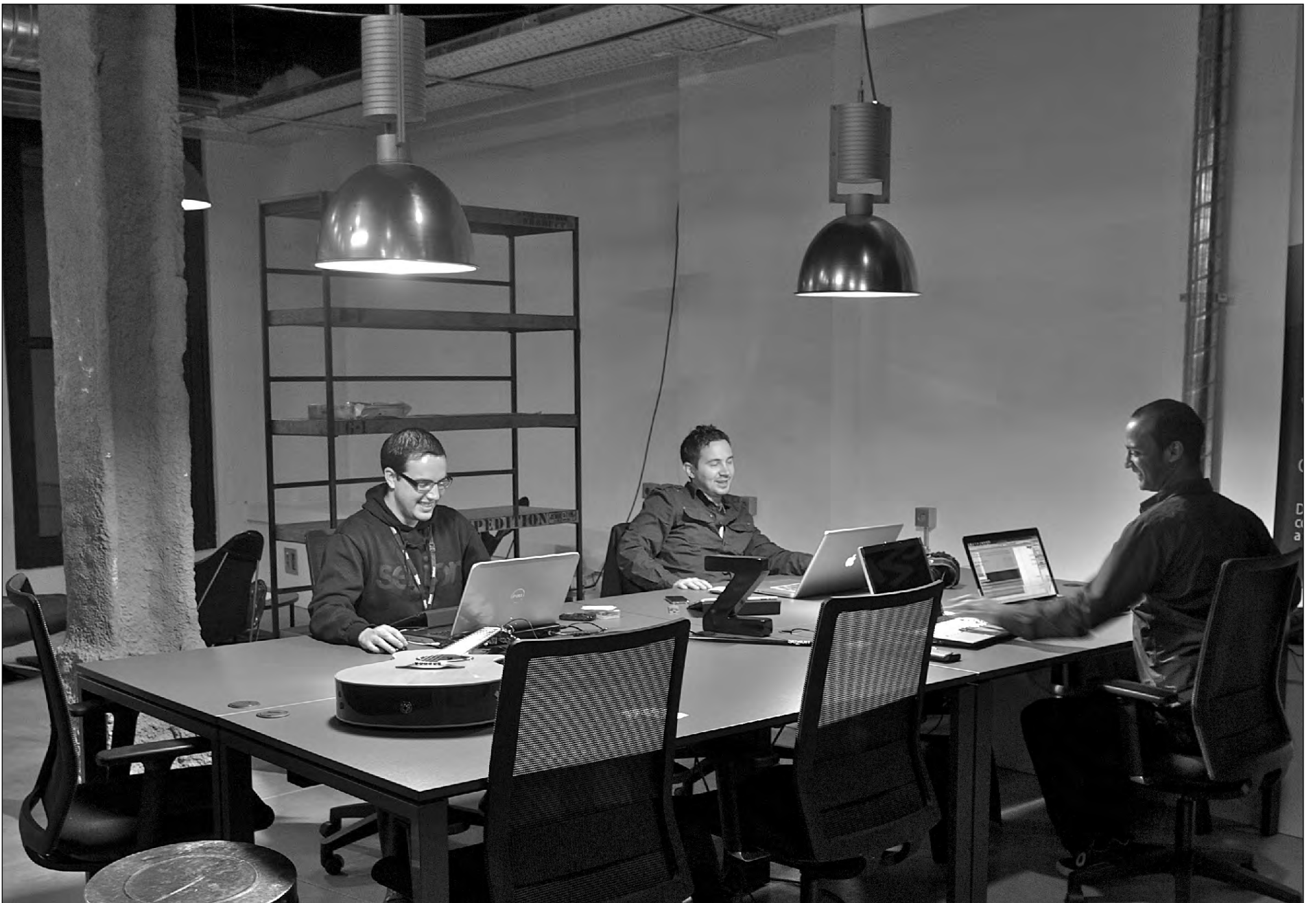
Telefónica acaba de inaugurar hace sólo unas semanas el primer espacio para facilitar la creación de empresas relacionadas con las TIC en España, la Academia Wayra Madrid.

Confiar y dar alas. Es el objetivo que se persigue en los denominados aceleradores de proyectos. Telefónica, en línea con su compromiso con la innovación, ha puesto en marcha una ambiciosa iniciativa para facilitar la creación de empresas relacionadas con las TIC. Se trata de Wayra,