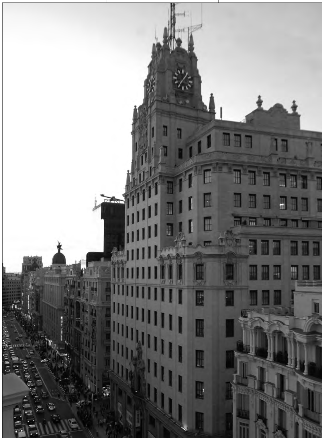
En la academia de Wayra Madrid, en Gran Vía, 28, se acelerarán diez proyectos.