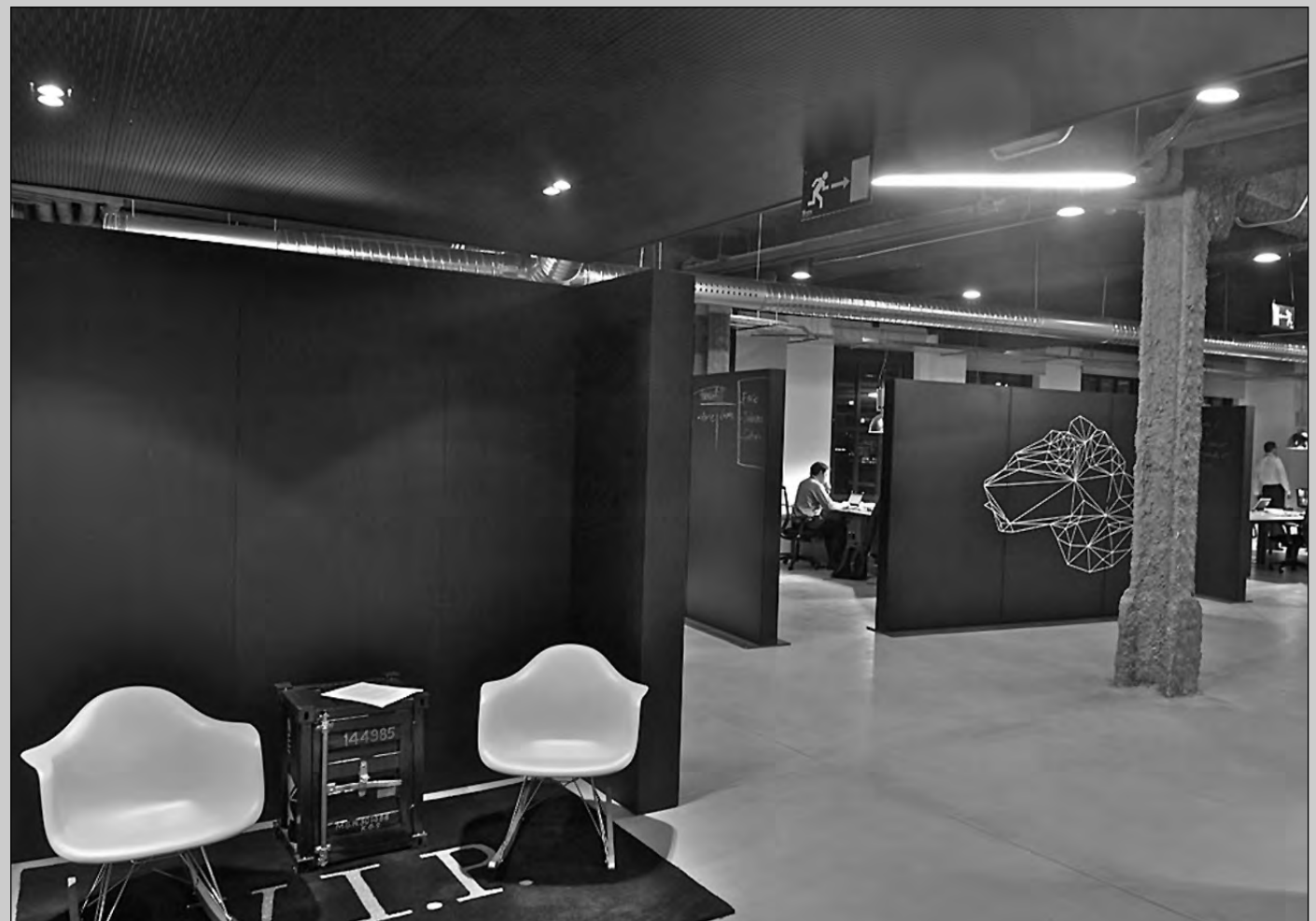
Los espacios de trabajo deben proporcionar el ambiente y herramientas que fomenten la creatividad.

Wayra es la esencia de este concepto, la innovación es su razón de ser."El espacio que hemos diseñado es fiel a este principio, un espacio para crear. Y lo hemos hecho sin puertas, sin barreras, pero potenciando la intimidad, sin la cual, la concentración creativa es difícil"—reflexiona. "Y esto lo hemos llevado a cabo mediante pizarras que conforman espacios individuales dentro de un todo común, en el que se comparten las ideas. La imagen es de sencillez, pero sobre todo de sinceridad, todo lo falso (techos y suelos) han desaparecido para