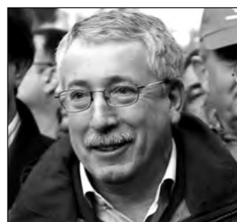
Ignacio Fernández Toxo.

que gobierna Miguel Ángel Fernández Ordóñez .