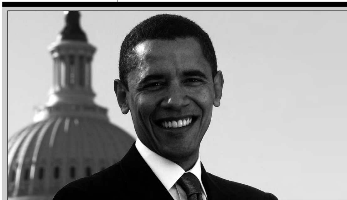
La esencia creada para Obama transmite aura de poder y un toque bohemio.