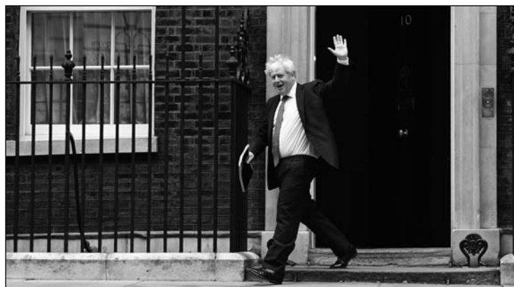
Boris Johnson amenaza con la ruptura.

Visto con ojos desapasionados el Brexit es un disparate, donde ganó un referéndum auspiciado por sentimientos nacionalistas, nostalgias y mitos 'románticos'. Pero una vez escuchada la voz de la ciudadanía, tanto para la UE como para Reino Unido (RU) era fundamental recomponer lazos comerciales estrechísimos y de gran solidez. Las negociaciones para el acuerdo de salida negociado han tenido un alto precio para Bruselas: ocupando este tema cumbre tras cumbre, dejando a un lado asuntos urgentes en la Europa pre Covid. En última instancia se llegó a un pacto de mínimos el pasado enero, con un ciclo que formalmente acaba a fin de año, pero donde, en teoría, se seguirán manteniendo estrechos vínculos. Pero Boris Johnson es un líder nacionalista-conservador-populista que admira a Donald Trump y no anda lejos de sus estilos. Justamente en la misma semana que Londres ( David Frost ) y Bruselas ( Michel Barnier ) dictaminan los últimos flecos para la nueva etapa en las relaciones que comienza el 1 de enero, el Gobierno británico mueve ficha y presiona con un proyecto de Ley de Mercado Interno que anula varios de los acuerdos con Europa, bajo la amenaza directa de que no sean aceptados por la UE y con la entrada del año se consumará una brusca salida sin acuerdo. El asunto es especialmente inoportuno para las dos partes, con economías conmocionadas por la crisis sanitaria y súbita histórica caída del PIB.