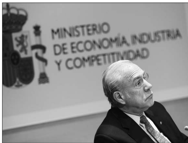
El secretario general de la OCDE, Ángel Gurría.

Son frecuentes las visitas a España de Ángel Gurría, secretario general de la OCDE. Y cada vez que visita el país Gurría realiza un verdadero maratón de intervenciones públicas y privadas, en las que le toca valorar y reflexionar sobre la situación económica del país. En este viaje, Gurría ha tenido que templar gaitas, después de que la OCDE rebajara las previsiones