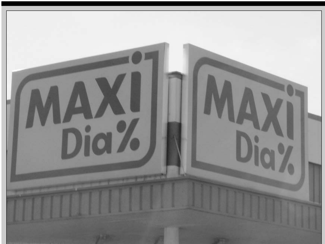
Una tienda de la cadena de supermercados.

Ya a la venta Pídale en Amazon: https://goo.gl/Lgm4H4