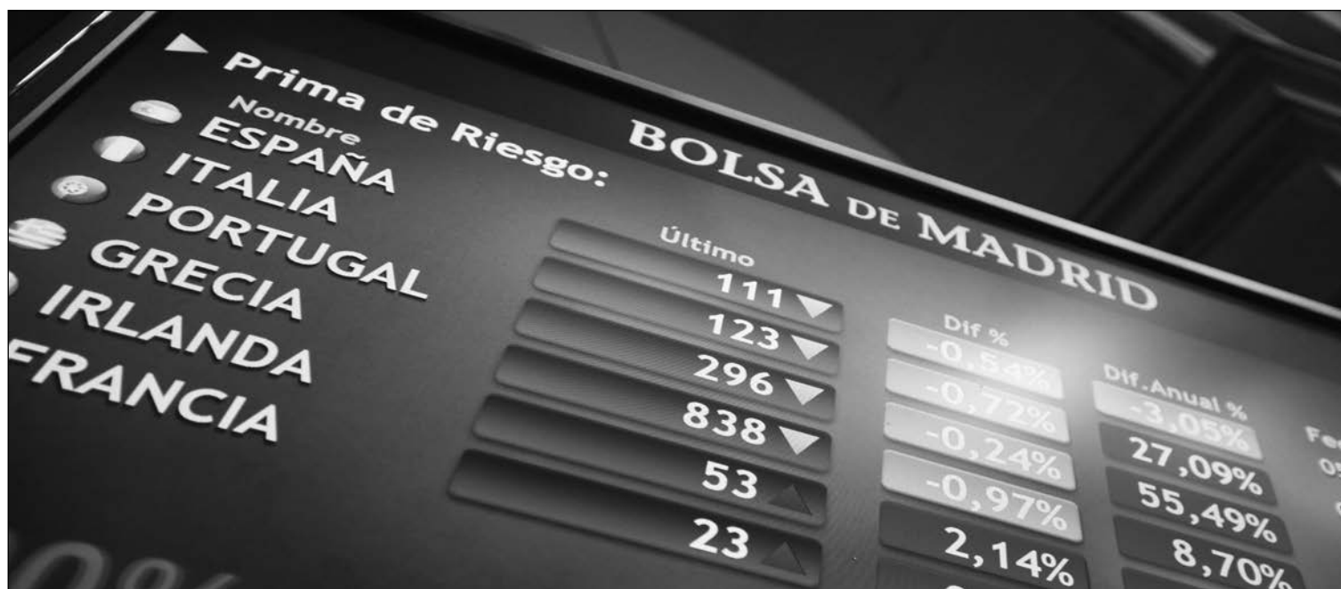
Bolsa de Madrid.

Los grandes valores españoles como Santander, BBVA, Iberdrola, Telefónica o Amadeus han perdido el respaldo de Wall Street vía ETF. Los inversores temen una nueva ofensiva de EE UU en su guerra de aranceles, en medio de las especulaciones surgidas sobre el futuro de Donald Trump y en un momento en el que las turbulencias con-