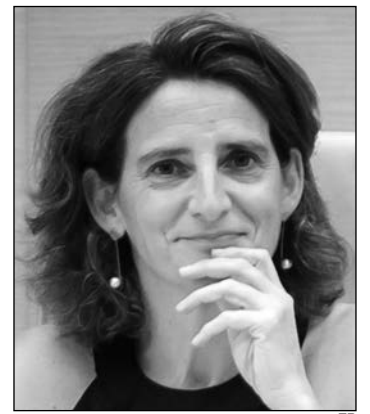
T. Ribera.

El eterno marrón de los titulares de Energía. El precio de la luz ha marcado este mes de agosto todos los récords hasta el punto de que la ministra de transición energética, Teresa Ribera está buscando fecha para reunirse con los principales presidentes del ramo, léase Ignacio Galán, Borja Prado y Francisco Reynés. Y eso que la ministra de transición ecológica ya se reunió en agosto con ellos. Ahora, lo hará con amenazas encima de la mesa.